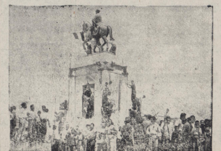
عده ای از مردم در میدان سه مشغول پائین آوردن مجسمه رضاشاه هستند

این جمعیت مرتباً افزایش مییافت در همین حین یکی از اجتماع کنندگان بالای لوله های آهنی کنار خیابان قرار گرفت و شروع بصیحت نمود چون احتمال وقوع حوادثی میرفت مامورین انتظامی که در داخل عکاسی و در چهار راه اسفندیول قرار گرفته بودند در صدمتفرق بقیه در صحنه هفتم