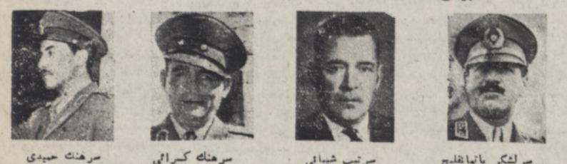
سرهنگ حبیدی، سرهنگ کسرائی، سر تیب شیبانی، سر لشکر باتمانقلیچ

رئیس گارد محافظ شاه در راهس. بمجرد ورود تهران توقیف شد در رشت و نندریه لوی از نصف شب دیشب حکومت نظامی برقرار گردید بهنامه بت کودتای نظامی سر لشکر باتمانقلیچ، سر تیب شیبانی، هیران رئیس دفتر مخصوص شاه، سرهنگ کسرائی و چند افسر دیگر دیشب و امروز بازداشت شدند دیشب منزل سر لشکر زاهدی بازرسی شد و فرماندار نظامی اورادریط، اعلامیه ای که منتشر کرده حاضر کرده است از منزل اوست پر وون یک چمدان کاغذ و اسناد بدست آمد یکساعت بعد از امروز امینی تقیل وزارت در باره آزاد گردید شب گذشته مامورین انتظامی منزل اغلب کسان را که دستگیر شده اند تفتیش کردند باز پرسان نظامی تانیمه شب گذشته از دستگیر شدگان باز پرس می کردند - امروز نیز از سحر سه مجدداً باز پرس از عاملین کودتا ادامه پیدا کرد