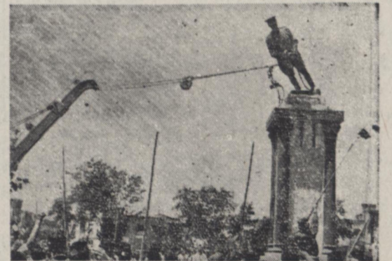
امروز در میدان بهارستان مردم مجسمه شاه را از زوری پایه پائین انداختند این عکس مجسمه مزبور را در حال سرتکون شدن نشان میدهد

از ساعت هشت صبح امروز مثل روز گذشته دستجات مختلف در خیابانهای لااله زار - اسفندیول - فرودسوی و نادری در حرکت بودند در چند نقطه نیز یکی از افراد بالای سکوئی رفته و سخنرانی مینمود. این تظاهرات تا مقادیر ساعت ده ادامه داشت و در اغلب خیابانها دسته دسته مردم بطول اجتماع مشغول تظاهرات بودند. اجتماع در مقابل عکاسی ساکو عکاسی ساکو برقی که روز گذشته موروسله تظاهر کنندگان قرار گرفته بود امروز از طرف مامورین انتظامی تحت حفاظت قرار گرفت. از اول وقت امروز مردم بتدریج در این مکان اجتماع میکردند. این جمعیت مرتباً افزایش مییافت در همین حین یکی از اجتماع کنندگان بالای لوله های آهنی کنار خیابان قرار گرفت و شروع بصیحت نمود چون احتمال وقوع حوادثی میرفت مامورین انتظامی که در داخل عکاسی و در چهار راه اسفندیول قرار گرفته بودند در صدمتفرق بقیه در صحنه هفتم