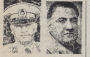
سرتیب فرزانه، سرتیب کیهان

در آنجا نام نوزادان پسر را «مصدق» میگذازند پس از برگزاری دوروز جشن در قاهره قرار بر نامه مخصوص حرکت ما از قاهره بود در اسکندریه نیز که شاهد جریان استغای فاروق و حرکت او از خاک مصر بودم اساسی با حضور نمایندگان مطبوعات خارجی جریان پایه که آن نیز در روز بطول می انجامید و بهین منظور در بچه در صحنه پنجم