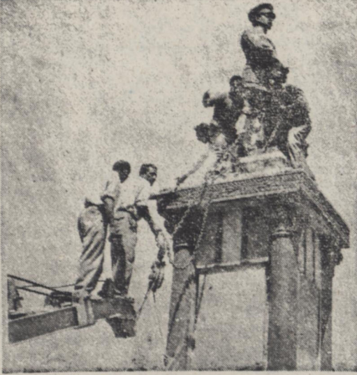
این عکس مجسمه رضاشاه را در میدان بهارستان هنگامیکه مردم با زنجیر آت را بطرف زمین میکشند نشان میدهد