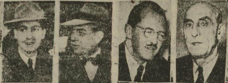
پروندهم کلارک لیب کوتر دکتر مصدق

دیشب معلوم شد که مسیون بانک بین‌المللی پس از یکماه اقامت در تهران و مذاکرات مفصل با مقامات دولتی و کمیسیون مختلط نفت با شکست روبرو شده و در طرف فردا و پس فردا تهران را ترک میکنند. پرده پوشی و خودداری از صحبت که اعضای کمیسیون در پایان هر جلسه نشان میدادند حاکی از این بود که بطور دلخواه مذاکرات پیشرفت ننموده و طرفین سعی دارند که برای مشکلات عمده راه‌حلی پیدا نمایند. جلسات طولانی اخیر که در باشگاه افسران و مجلس شورای ملی تشکیل میشد نیز نمکی به بر طرف کردن اختلافات و ایجاد توافق ننمود و هر یک از طرفین بر سر حرف و ادعای خود ایستاده بودند تا اینکه دیروز صبح اطلاع حاصل شد هیئت مختلط عصر در منزل آقای نخست‌وزیر جلسه خواهند داشت.