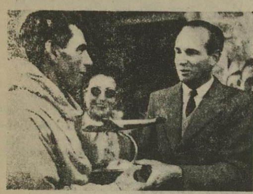
رئیس نمایندگی ارفرانس در ایران کاپاسکی دایر برندگان اهدا میکند.

امسال نیز مانند سالهای قبل از طرف شرکت هوایی «ارفرانس»