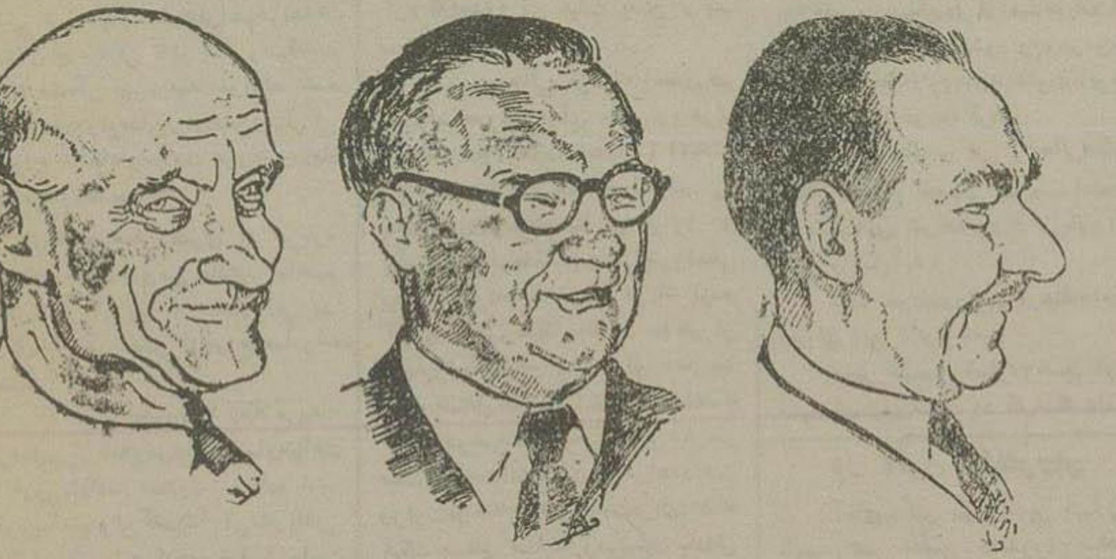
روبو شومان وزیر خارجه فرانسه ارنست اوین وزیر خارجه انگلستان دین اچسن وزیر خارجه آمریکا

کنفرانس عابده کان عضو هیات امنه اتلانتیک شمالی دیشب با صدور اعلامیه مشترک بیان یافت و امروز سه وزیر خارجه انگلیس، آمریکا و فرانسه برای دعوت آلمان بترکت در دفاع باختری اروپا تشکیل گردید ژنرال ایزنهاور برای احراز مقام فرماندهی باروپا میاید دوازده دولت اروپای باختری مشترکاً به اجس و عهده دادند تا آنجا که در قدرت دارند علیه تجاوز کمونیسم تجهیز شوند و بدین ترتیب شب در بروکسل اعلام شد اروپا در بر ابر خطر کمونیسم سنگر گرفت