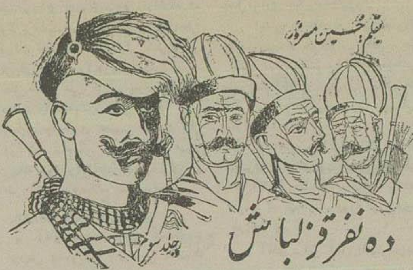
وه نفر قزلباش

اگر بدفاتی بانک مراجعه کنید خواهید دید هر دوقه که خواسته اند از امریکا برای من پول فرستند شخص ناشناسی با امضای منی که البته وجود حقیقی ندارد یک هزار و پانصد دلاری با امضای یکی از مشتریان بانک و با امضای یکی دیگر از بانکهای شهر بانک مخصوص فرستاده و در نامه ضمیمه هم نوشته است که این پول را از بانک حق الاختراع بفلان شخص برسانید و بانک هم بدون اینکه فکر کند این پول از کجا است و برای چه منظوری است پول را این رسانده است.