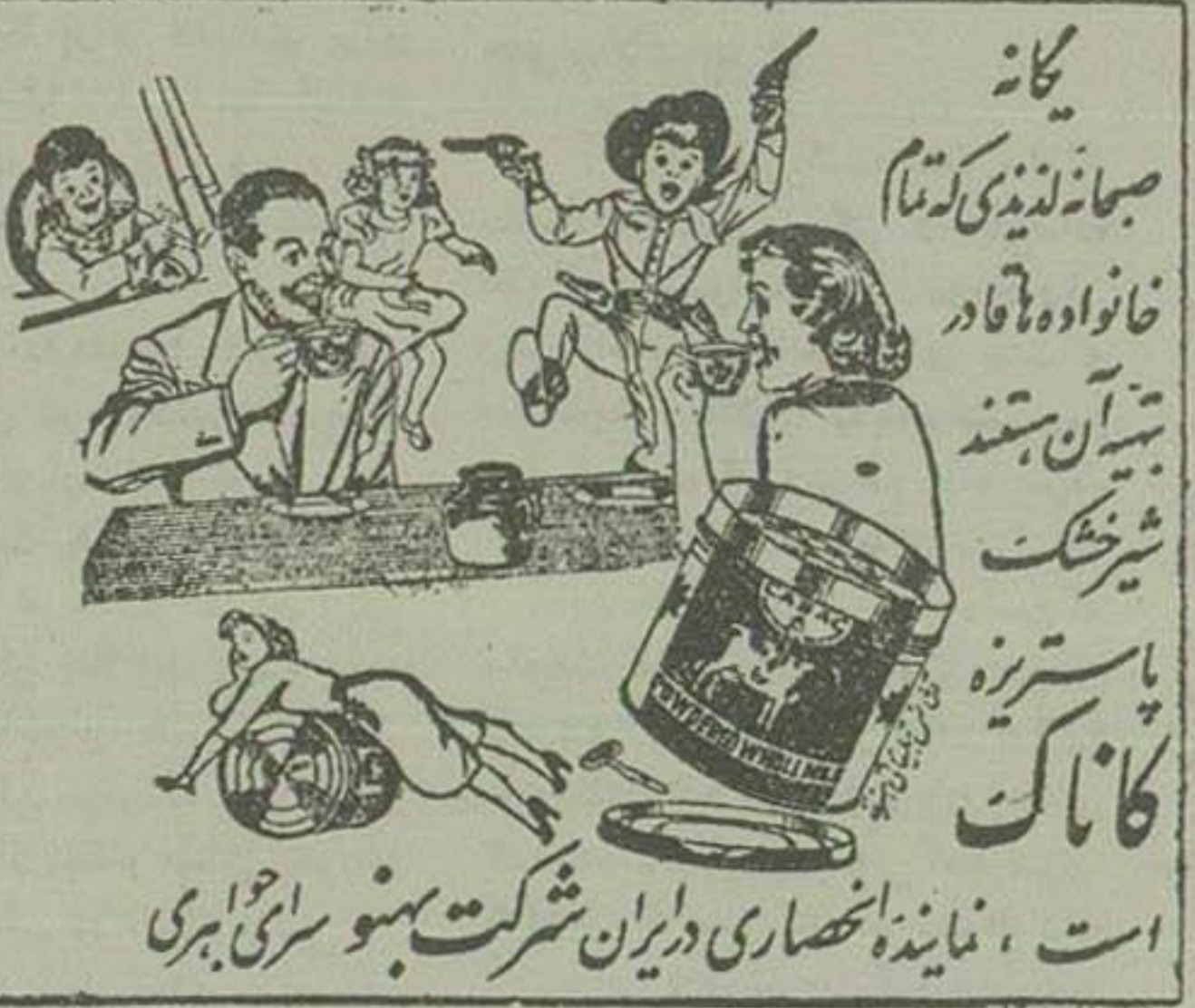
است، نماینده انحصاری ایران شرکت بنو سرلی ابری

وزیران امور خارجه دول بزرگ نیز در این کنفرانس شرکت خواهند کرد و قبل از تشکیل این کنفرانس در نیویورک و سافرانیکو راجع بتهیه مقدمات آن مذاکره بعمل خواهند آورد. دالس دوبایان اظهار داشت که