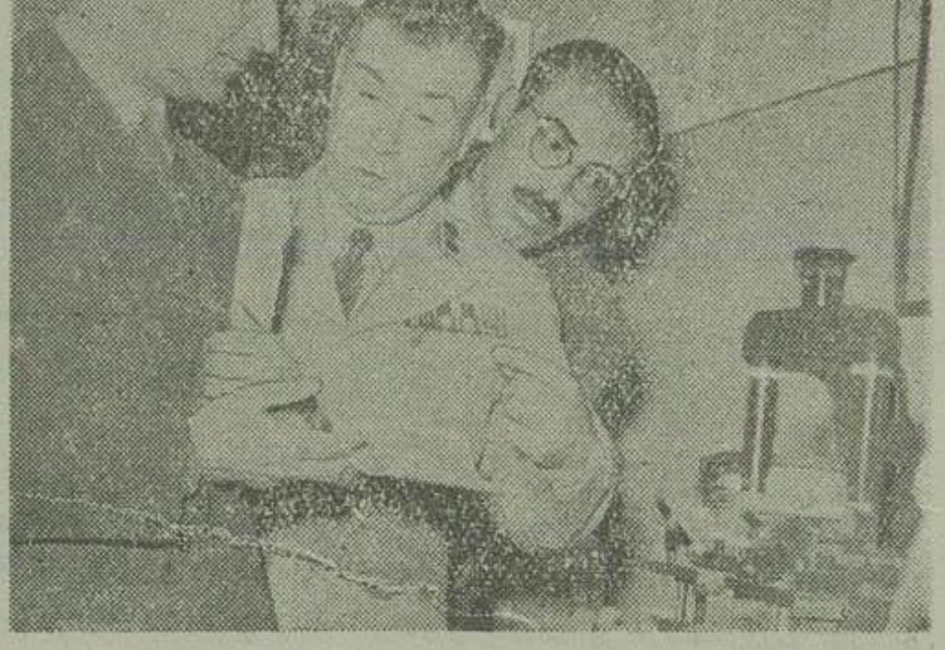
آقای علم وزیر کشور یکی از دستگاههای تشخیص جرم را بازدید میکند

دستگاه دروغ شنج صحت و سقم اظهارات متهمین را مشخص میکند دیشب مراسم افتتاح اداره تشخیص هویت در حضور وزیر کشور و وزیر دادگستری برگزار شد