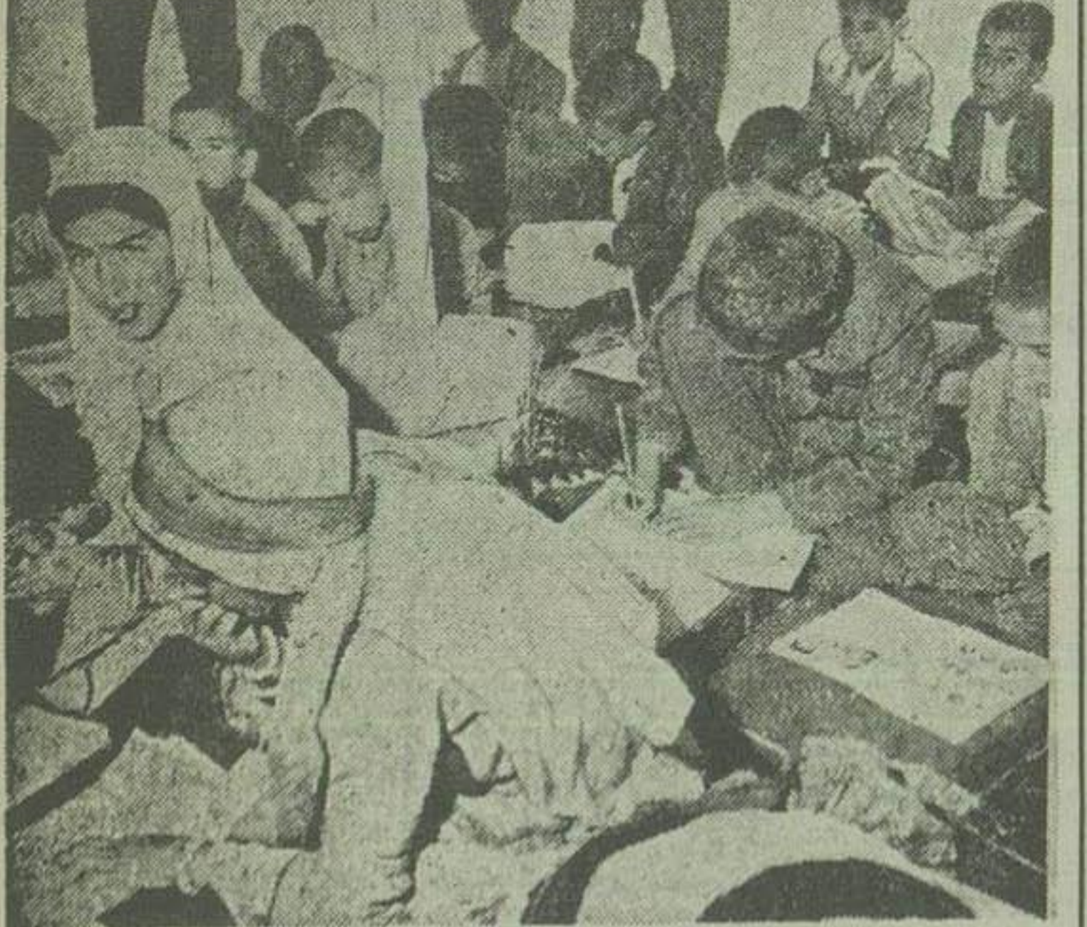
مدهای از کودکان پسر و دختر عشیره ای در کلاس های بسیار مشغول خواندن و نوشتن هستند

و در کلاسهای بسیار خواندن و نوشتن میآموزند چون موضوع باسواد شدن افراد ایلات و عشایر ایران در قاطب مضلف کشور مورد توجه دولت قرار گرفته لذا از طرف قسمت فرهنگی اداره اصل چهار با همکاری وزارت فرهنگ برنامه های مخصوصی برای باسواد کردن کودکان عشیره ای با ایجاد مدارس بسیار عشایری تنظیم و بر حله اجرا گذاشته شده است مریمان مدارس عشایری که از بین خود افراد ایلات انتخاب شده اند طی دوره مخصوصی اصول جدید تعلیم و تربیت و طریق باسواد کردن افراد عشایر را فرا گرفته اند و نکته قابل توجه اینست که هر موقم افراد ایلات بخواهند بیلاق تعلق نمایند میتوانند کلاسهای خود را در چادرهای مخصوصی تشکیل میدهند در همان نقطه دایر کنند.