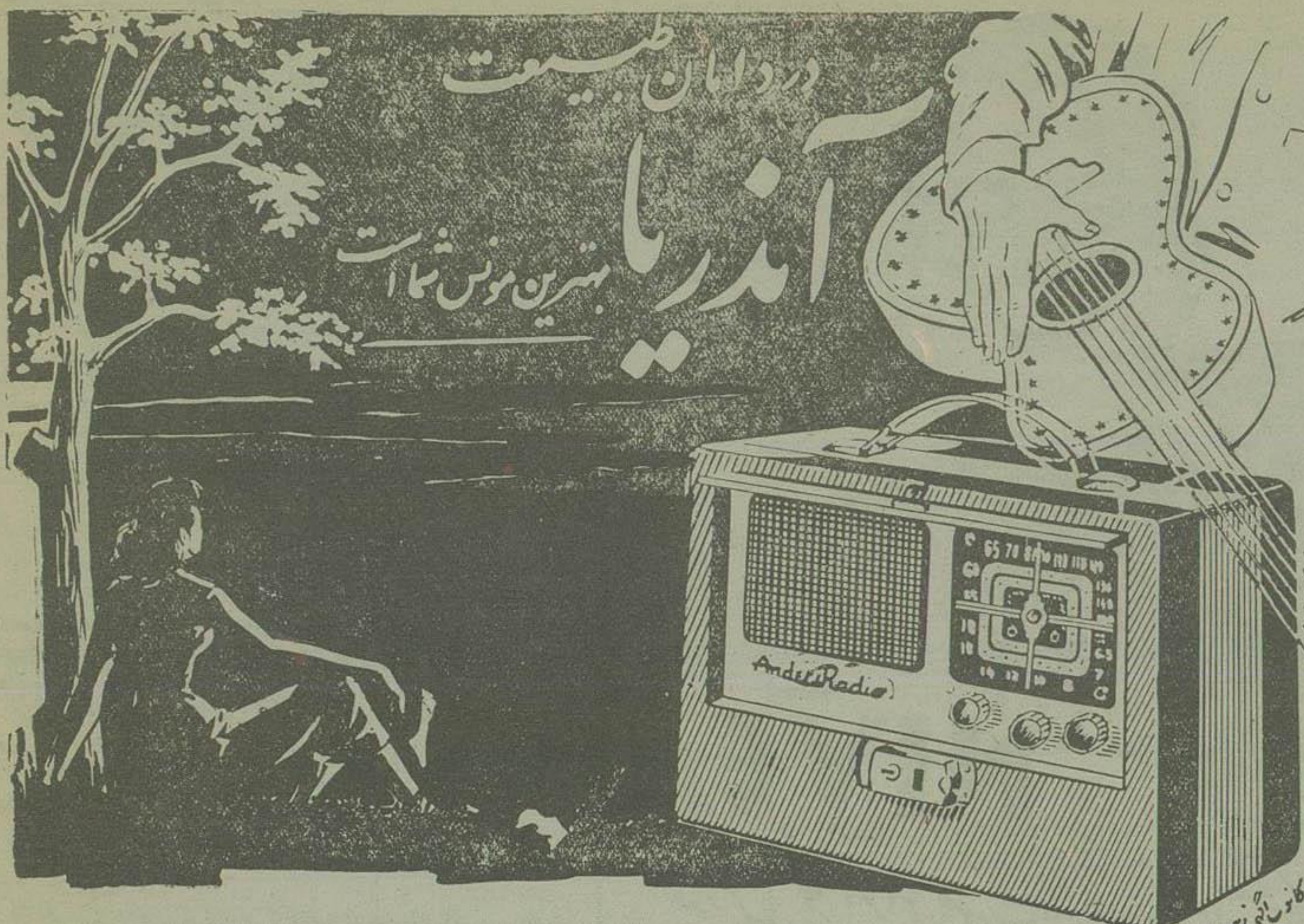
محل فروش - لاله زار فروشگاه رادیو آندریا تلفن ۳۶۳۳۵ در شهرستان ها به نمایندگان رادیو آندریا مراجعه نمایید ۴۹۱۵-آ

اخیراً دولت شوروی بفکر افتاده که عده ای کارشناس فنی هندوستان بفرستد دولت هند بنا بر مصیبت خود این پیشنهاد را پذیرفته است و دسته اول این کارشناسان بینه آمده اند. البته این کارشناسان فنی در درجه اول مامورین تبلیغاتی هستند و دولت شوروی امید دارد با یک آنها حزب شکست خورده کویست هند را تقویت کند. اما این هغه شوروی هم نتیجه است زیرا اولاً طبق قرارداد اگر این کارشناسان فنی ذره ای از حدود کارشناسی فنی تخطی کنند اخراج می شوند.