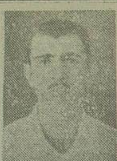
استعفاء از حزب غیر قانونی توده