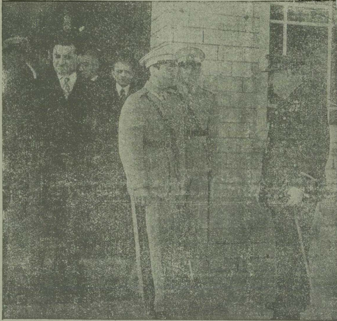
اعلیحضرت همایون شاهنشاهی و جناب آقای ونستون چرچیل نخست وزیر انگلیس و جناب آقای سهیلی و جناب آقای علاء وزیر دربار و جناب آقای ساعد وزیر امور خارجه و جناب آقای سرتیپ شمالی وزیر پیشه و هنر و آقای ماکسیموف کاردار سفارت شوروی نیز در عکس دیده میشوند.