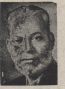
ظفر الله خان

قونولگری پس گرفته و بلاوه چون تجارت میان پاکستان و تبت و چین - جریان های خود را در ادبستن قونولگری تأثیری در این موضوع نخواهد داشت منطقه هانزا که اولین تصادم میان قوای چین کمونیست و سربازان مرزی پاکستان در آنجا رخ داده منطقه ای است که در مجاورت مرزهای - چین افغانستان - پاکستان - شوروی - قرار دارد و کوههای بلندی که از مرز تبت چین چال دنیا است این منطقه را پوشانیده است خبرگزاری فرانسه اضافه میکند از مدتی قبل احتمال داده میشد که میان سربازان مرزی چین کمونیست با قوای دربار لمان آن کشور اعلام کرد که قوای چین کمونیست برای اولین دفعه به مرز پاکستان تشریح کرده و در منطقه کوهستانی هانزا در منتهای نقطه شمالی پاکستان به سربازان مرزی حمله نموده است وزیر خارجه پاکستان اضافه کرد که اقدامات استیجابی در منطقه مرزی پیل آمده است او سپس گفت: در این زمینه صلاح نیست پیش از این اظهار بیانیه صادر شود تا زمانی که قونولگری پاکستان در استان سینکیانگ چین که فردای روز تشکیل دولت پاکستان ایجاد شده و نظارت تعطیل شود زیر دولت چین کمونیست شناسایی خود را نسبت باین