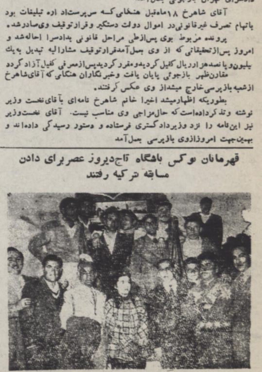
قهرمانان و کس بافکاه تاج دیروز عصر برای دادن مسابقه ترکیه رفتند. این عکس در مقابل اتوبوس پیکان جت - است - در جاده کرج برداشته شده است. جریمان عزیزت این تیم را در مسابقه پنجم بخوانید.