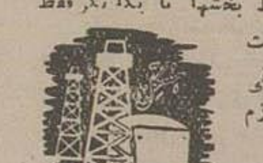
از این بخش فقط در سه بخش «لوردجان»

آقای سرتیب اسعد بختیاری فرماندار بختیاری و چهارم حال در جواب استوالاتی که خبرنگار ماد هفتکل از ایشان نموده چنین اظهار داشته است: وضع ارتباط فرمانداری بختیاری و چهارم حال که دارای ۹ بخش میباشد بکلی ناقص و غیر متناسب است، زیرا ارتباط بخشها با یکدیگر فقط بوسیله قاصد یا سوار انجام میگردد، فرض هر وقت کاری با شهر کرد مرتز فرمانداری از مرکز قشلاقی بختیاری که ایله است داشته باشیم اقلایکما وقت لازم دارد تا آنکه مراسلات درویدل شود.