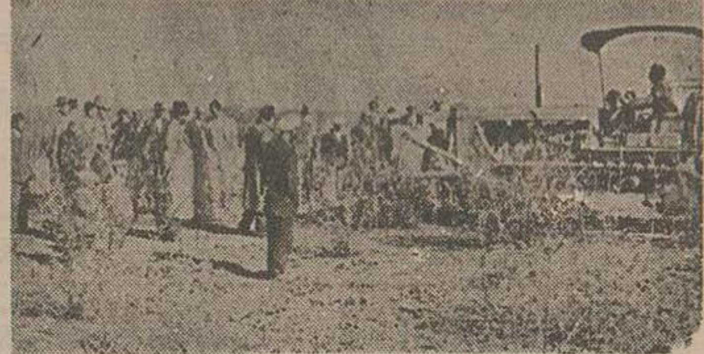
بازدید از طرف عمل ماشین آلات کشاورزی

چندی قبل از طرف متصدیان کارگاه سد اخنوخان کلیایگان برای آزمایش مقداری آب در مخزن سد نگاهداری شده بود اخیراً پس از خاتمه آزمایش مجرای توپل مخزن را باز کرده و آب مخزن بطرف شهر و دهات سرازیر شده در نتیجه علاوه بر خساراتی که بر ارضین وارد آمد قسمتی از قنات آب شرکت سهامی موتور آب کلیایگان را که اهالی از آن استفاده می نمودند منهدم و ویران نمود اهالی از مقامات مسئول تقاضای عطف توجه دارند.