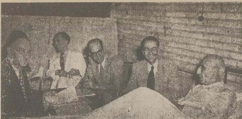
انای دکتر مصدق - آقای امیر علانی - آقای دکتر شایگان - آقای اللهبهار صالح - آقای وزیر بهاری در جلسه پریش هیئت دولت و کمیسیون مختلط نفت

فوق آمده مزبور تصریح کرد که در جلسه مزبور برخلاف آنچه شایع می‌باشد مصلحتا در اطراف پلا یسگاه آبادان و تعطیل احتمالی آن در روز سه شنبه مذاکراتی صورت نگیرد و تمام وقت جلسه صرفا بجهت جواب هر یمن گذشت.