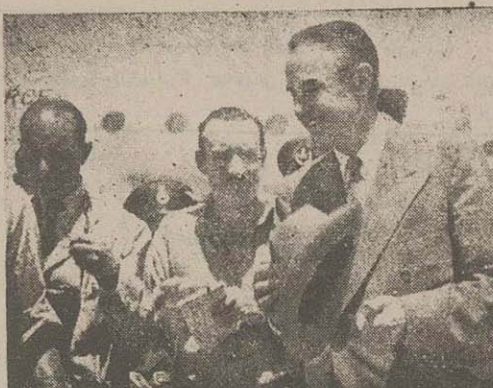
آقای هر یمن در فرودگاه مهر آباد هنگام ورود مواجه با ازدحام خبرنگاران خارجی شد و در عکس بالا وی به سئوالات خبرنگاران پاسخ می‌دهد

او در فرودگاه اظهار داشت من بیش از پیش اطمینان دارم که مسئله نفت ایران بطور دسانت آیز حل خواهد شد