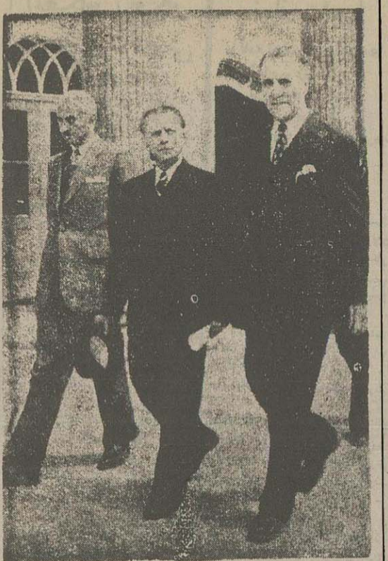
هیئت وزیران با دو وزیر خود سرلشکر زاهدی و وزیر کشور و سز لشکر اورم و وزیر راه مجلس را ترک نمودند