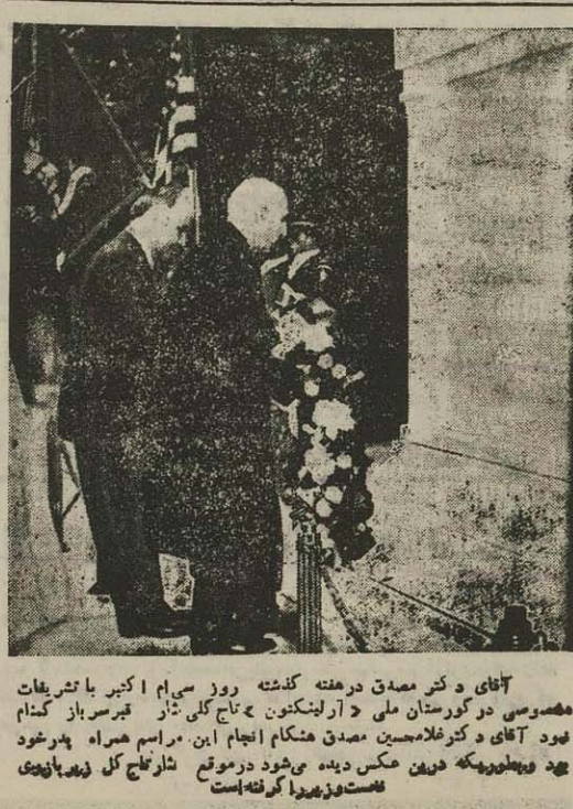
آقای دکتر مصدق در هفته گذشته روز سیام اکتوبر با نشریات همسوسی دو گورستان ملی و آریلنگتون تاج کلی تاز قبرس باز گننام بود آقای و کز غلام حسین مصدق هنگام انجام این مراسم همراه پدر خود بود و بطوریکه درین عکس دیده میشود در موقع شلر تاج کلی زین با نوبی قامت و زین را گرفته است

روزنامه اهرام می نویسد بالاخره این نظر مصر بیا که ملت دولت مصر بایستی در صدد جنک اقتصادی بر ضد انگلستان بر آید بایستی عملی شده و راست است که انگلستان می تواند به تمام متقابل کند مثلاً بخبره از روی مصر در لندن را که بالغ بر چهل میلیون پوند است توقیف نماید ولی اگر انگلستان چنین اقدامی متوسل شود مصر در برابر پشینی ای قیه در صفحه سوم