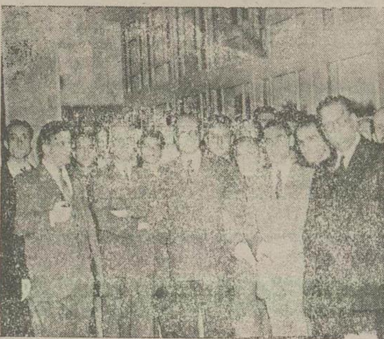
آقای وزیر فرهنگ در میان استادان و دانشجویان