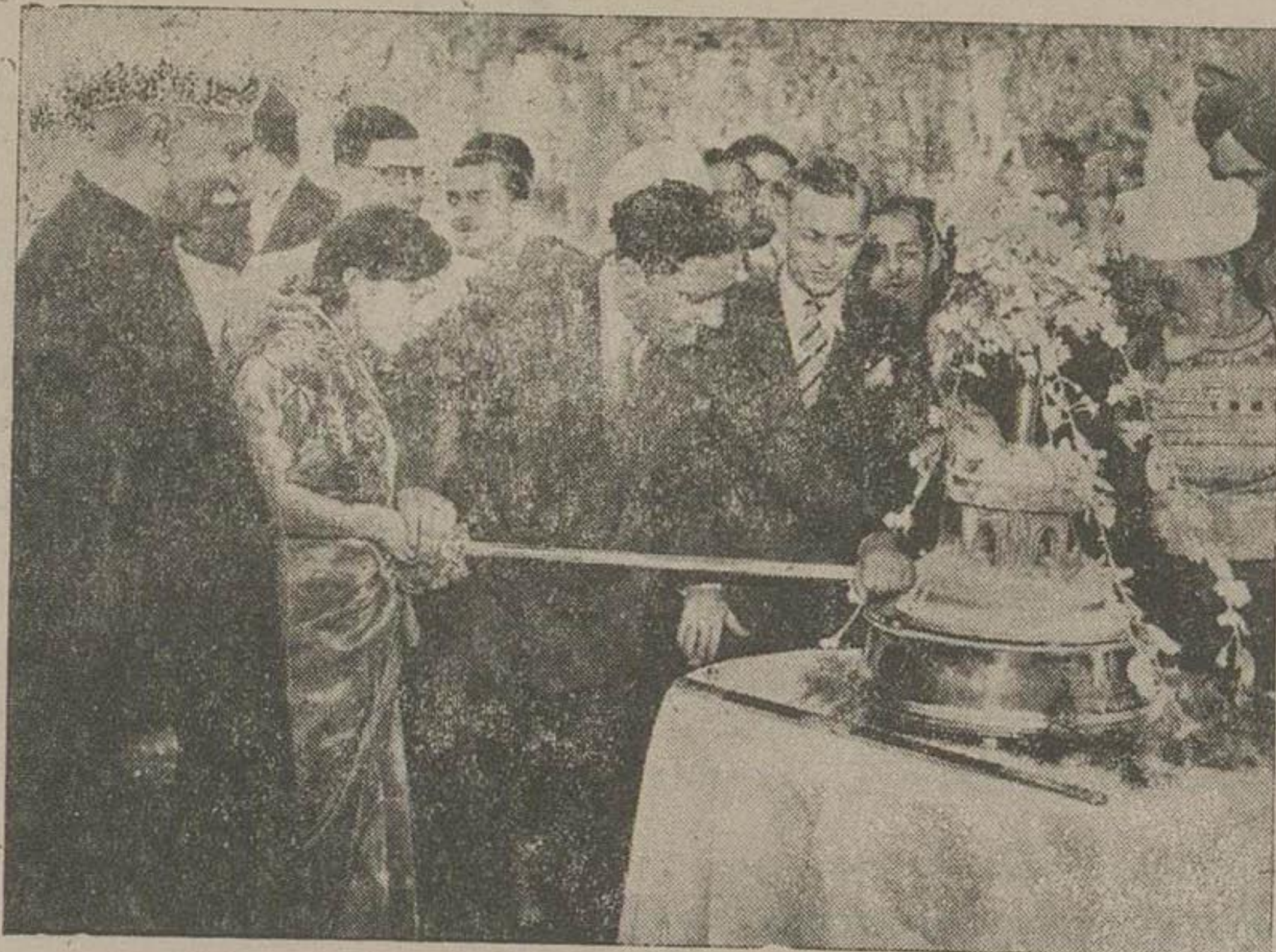
چند روز قبل منشی نظامی رئیس جمهور هندی مازور «معدینون خان» ازدواج کرد و در جشن عروسی او رئیس جمهور هند راجندر پرساد نیز شرکت کرد. در این عکس رئیس جمهور هند هنگامی که داماد و عروس مشغول بریدن کیک مخصوص عروسی هستند مشاهده می شود.

واشنگتن - آرسیندیرس - دیشب در حضور او ن لاتیهور در جلسه شهادت که در حضور جمعی از سناتور ها تشکیل در دیدار سونند یاد کرد که کلیه اتهامات سناتور مک کارتی مبنی بر اینکه وی عضو حزب کمونیست و عامل شوروی است دروغ است.