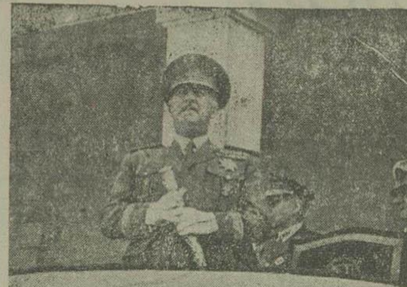
در این عکس فرانکو هنگام رژه نیروهای اسپانیا مشاهده می شود.

هرساله در مادرید بناسبت بپایان جنگ های داخلی مراسم رژه در حضور ژنرال فرانکو بعمل می آمد ولی چند روز قبل که مصادف با یازدهمین سال پایان جنگ های داخلی اسپانیا بود رژه ای که در حضور فرانکو بعمل آمد خیلی ساده و مختصر بود و فقط در آن پیاده نظام اسپانیا شرکت داشتند.