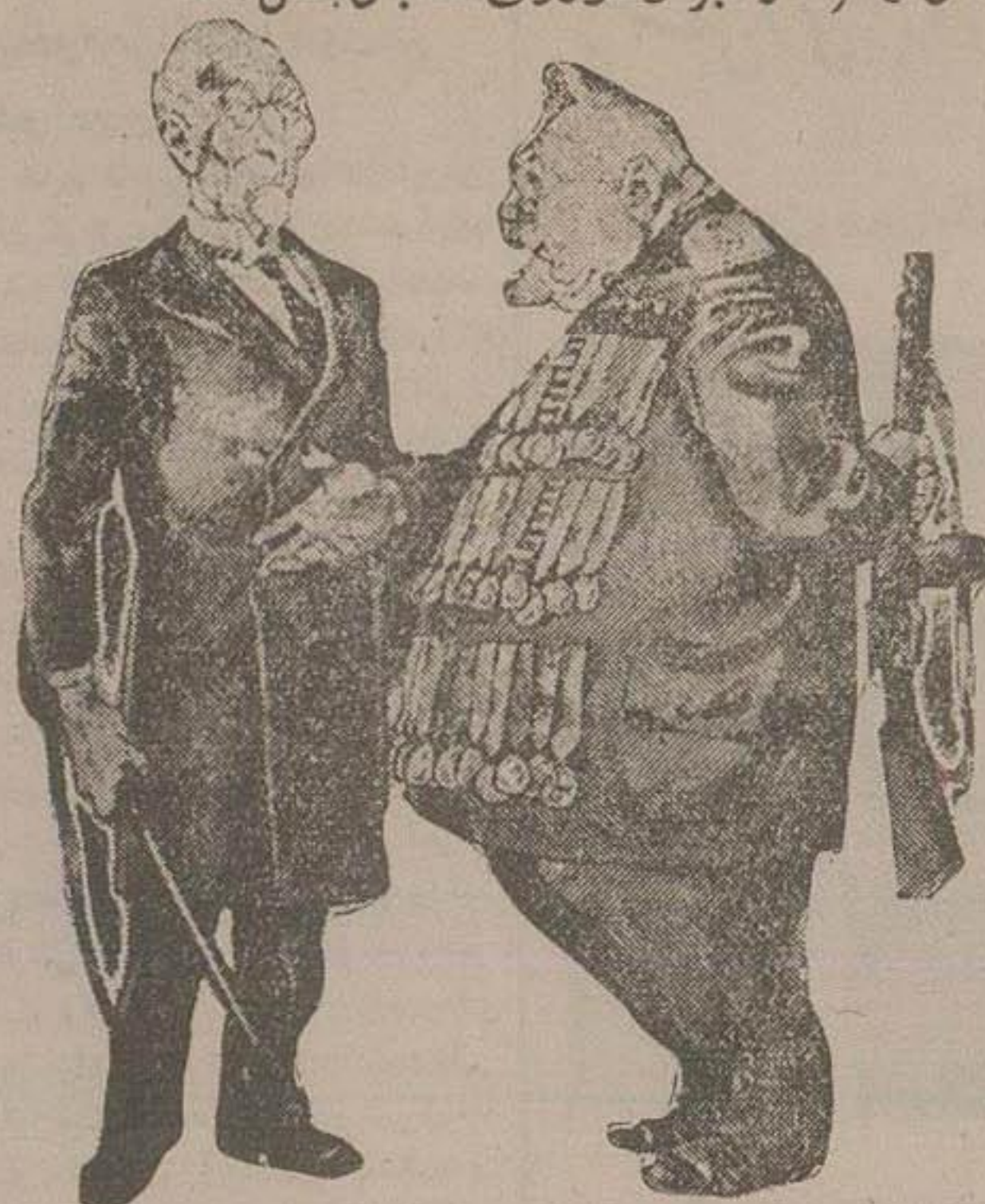
مارشال ولگانین به آدنائر

از دکتر ادنائر هنگام ورود بمسکو از طرف رهبران شوروی استقبال بعمل آمد