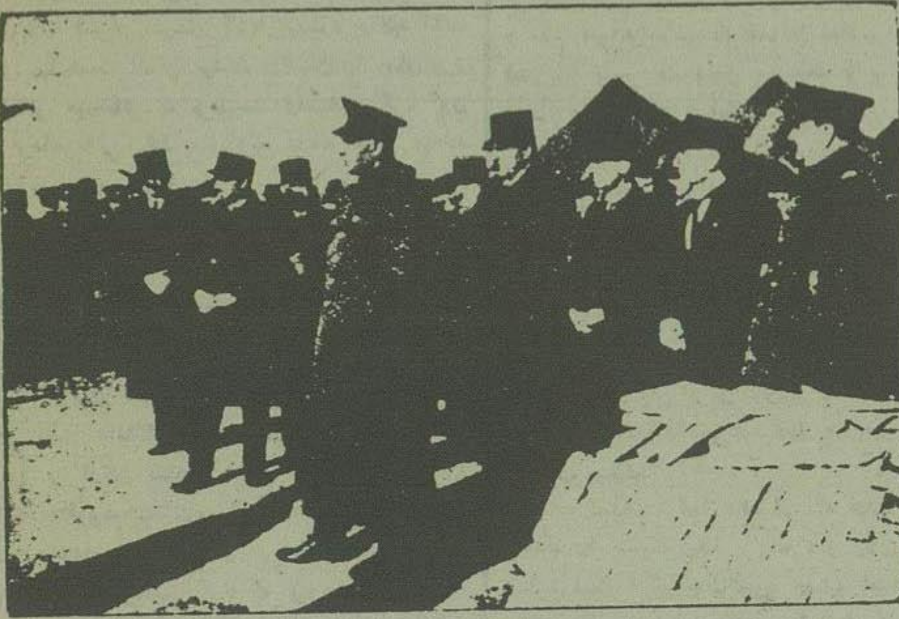
اعلیحضرت همایونی هنگام اجرای مراسم نصب اولین سنگ بنا.