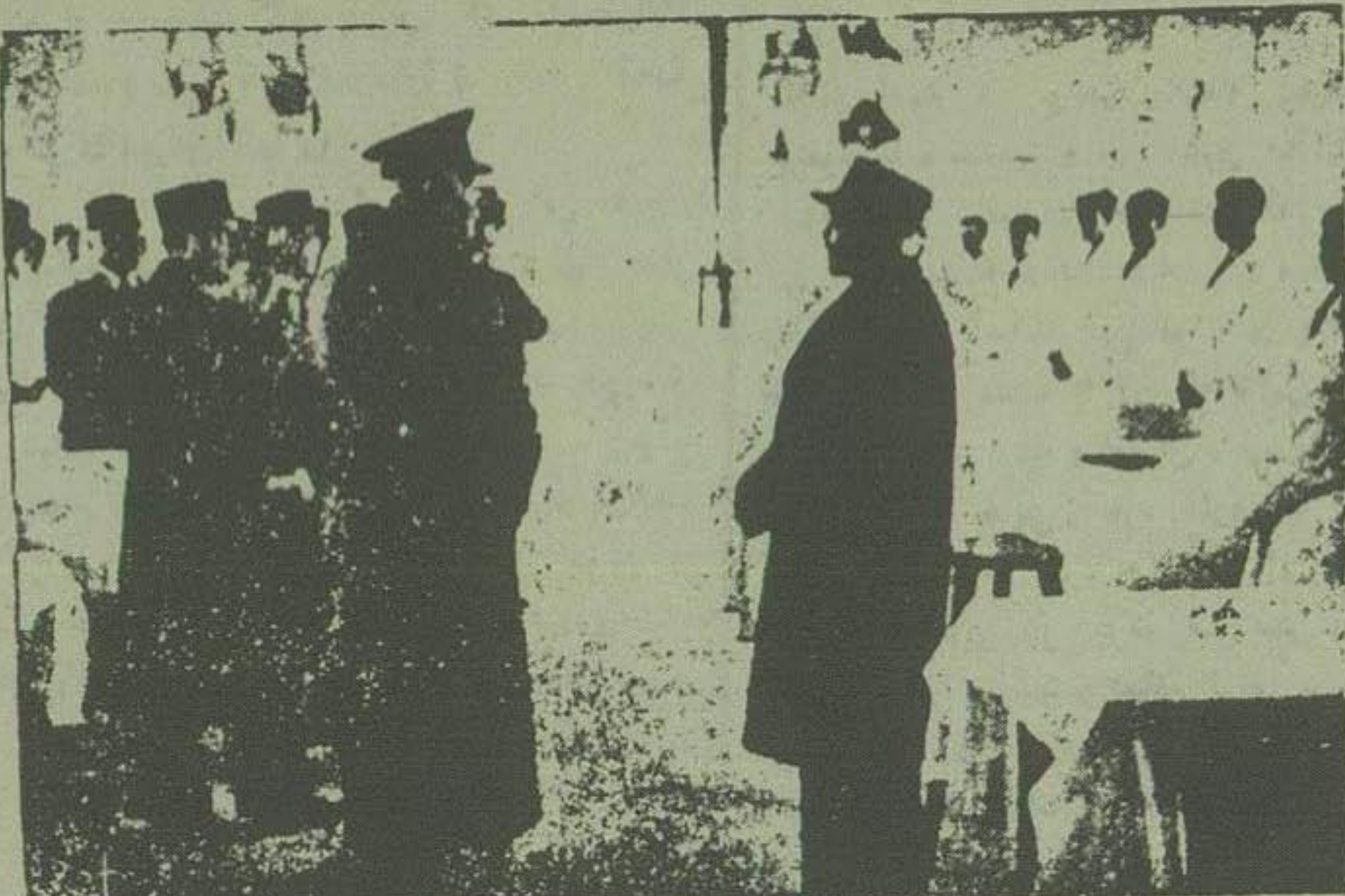
اعلیحضرت شاهنشاهی برای نصب لوح بنا تشریح فرما می شود. آقای کبیل وزارت معارف با اشاره دست محل دانشگاه ها را برض ملوکانه میرساند.