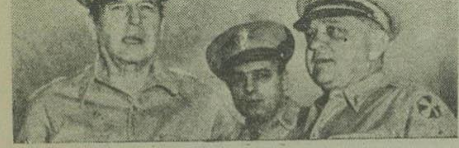
ژنرال ماک ارتور فرمانده کل نیروهای سازمان ملل متحد و ژنرال والون واگر فرمانده لشکر هشتم امریکائی که با پیاده شدن در جزیره ها، حاکم کرده

ژنرال ماک ارتور در میان شعله های آتش وارد بندر اینچون گردید ارتش امریکا تعرض و پیشروی خود را آغاز کرده