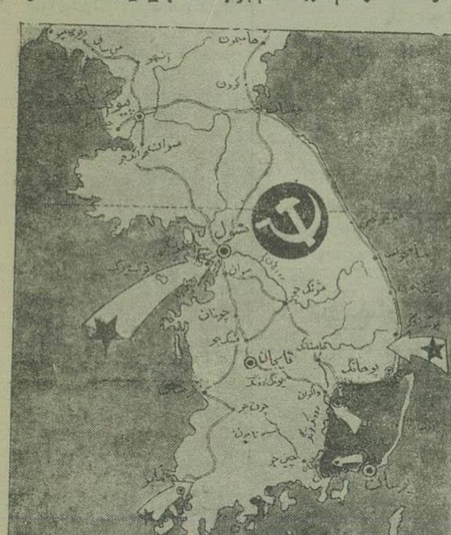
قطب پیاده شدن سر بازان امریکا در پشت سر بازان گهوه نیمه شمالی