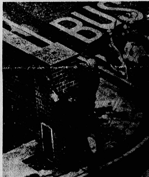
مجاوزه از ۳۰۰ پلیس مسلح انگلیسی از آغاز ماجرای گروگانگیری اعضای سفارت ایران در لندن، سفارتخانه را بمباران کرده و فرار دادند. در این تصویر که صحنه ای از اوقات دائمی پلیس از ساختمان سفارت ایران نشان میدهد، دو تن از افراد پلیس سرگرم پاسداری هستند. اغلب افراد پلیس جلوه شد گزله بتن دارند.

بررسی فارسائی های سفارتخانه های ایران در کشورهای عربی