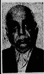
سرانجام ابوالفضل تقوی رئیس ساواک اصفهان که در دادگاه انقلاب اسلامی اصفهان شایا محکوم به اعدام شده بود، در وزارت امور خارجه کشور ما بفرمان حای سفارتی نواجه بود نظر سفر را مولفیت امیر خواند و در اکثر موارد بین نظریات جمهوری اسلامی و بعضی کشورها اتفاق نظر وجود خواهد کرد. وزیر امور خارجه گفت: تا زمانی که من در وزارت امور خارجه کشور ما بفرمان حای سفارتی نواجه بود نظر سفر را مولفیت امیر خواند و در اکثر موارد بین نظریات جمهوری اسلامی و بعضی کشورها اتفاق نظر وجود خواهد کرد.

موقالمانه بود و گریه و زاری را پائین می آورد. مشکل اصفهان بود شورای انقلاب همه امارات متحده عربی این بود که وزیر نفت آن کشور اعلام کرده بود تولید نفت خود میکنند با توجه به مسایل خارجی باز هم این سفر مدتی توافق شده نه تنها تولید بود و با امام هم که صحبت شده است. این سفر ضروری کرده و با بهره با توجه به موضوع مطرح شد زیرا شد البته میبایست زودتر انجام میشد. گامش تولید نفت در مورد آنچه به کاشف تولید نفت است نظام کتل خود به اطلاع دوستان خود رسانید که هیچگونه داد تولید نفت خود را تقبل نمیدند. ما به پیشنهاد شکست در روز تولید کردیم و این رقم زیادی نیست با این وجود اعلام کرد. چنانچه دولت ایران بخواهد مسلح تولید نفتشان بهره در مسایل