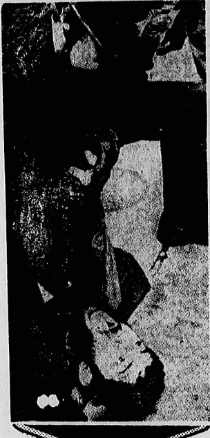
در جریان حمله ۵ تروست مسلح به سفارت ایران در لندن ماجرای های بسیاری در رابطه با رفتار پلیس انگلستان با تظاهرکنندگان ایرانی بود و می توان گفت نظر این مصلحت پنداران دور کردن جوان ایرانی از مقابل سفارت ایران در لندن باو گراویز شد و او را نقش زمین کرده است. معمولاً پلیس با کتف و کمرهای پلیس لندن با انبوه ایرانیان مقیم لندن که بطور شبانه روزی در برابر سفارتستان انتظار اسلیمی ایران و علیه تروستهای گروگان گیر شمار میدهند، رفتاری خشن و همراه با کینه است.

یکشنبه ۱۴ اردیبهشت ماه ۱۳۵۹ - شماره ۱۶۱۲۲ - تک شماره ۱۵ - ریسال