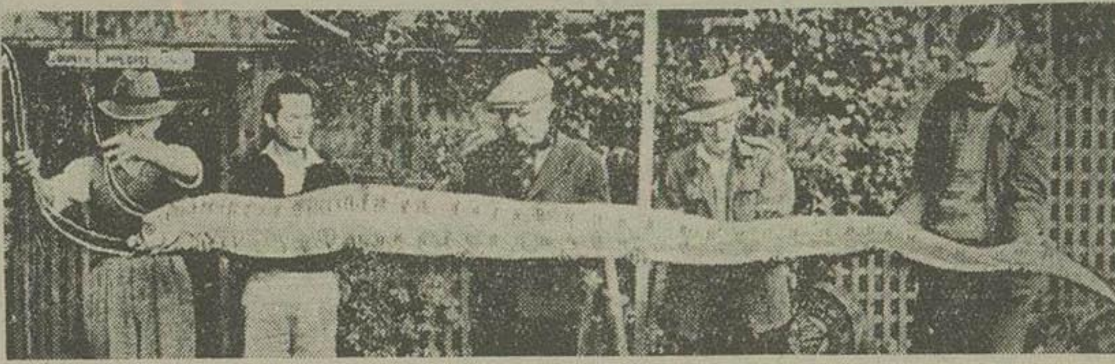
سیدنی - در سواحل استرالیا فصل ماهیکیری فرا رسیده است. یکی از ماهیکیران استرالیائی بعد از صید جانوری که در عکس بالا دیده می شود و طول آن ۱۳ با است تصور کرد یک هیولای میب در پانی را بدام انداخته ولی یکی از مامورین موزه تاریخ طبیعی سیدنی بعد از مشاهده آن اظهار داشت که جانور مزبور از انواع ماهی است که معمولاً طول آن کم است ولی گاهی بطور استثنای طول آن بچهل مایرسد

واشنگتن - خبرگزاری فرانسه - سرویس چرچیل نخست وزیر انگلیس و دالس وزیر امور خارجه آمریکا دیروز ساعت شانزده و با نوزده دقیقه سان سینمای کاخ سفید را ترک کردند در این سینمای خصوصی فیلم مسافرت الیزابت دوم ملکه انگلستان به استرالیا و ژلانجیدیه نمایش داده شد.