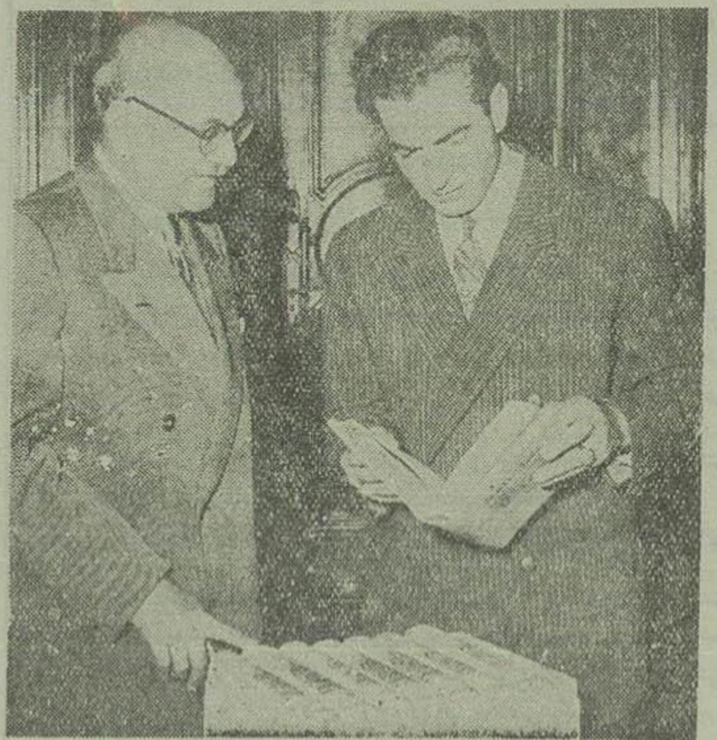
اعلیحضرت همایونی یکجلد از کتابهای گاندی را ملاحظه میفرماید و آقای دکتر تاراجند سفیر کبیر هند توضیحاتی بر مریساند ساعت ۹ و ۱۰ صبح امروز آقای دکتر تاراجند سفیر کبیر دولت هند در کاخ مرمر بحضور ملوکانه بقیه در صفحه ششم

یکدوره از کتابهای فعالیت های «ماتما گاندی» توسط سفیر کبیر هند پیشگاه شاهنشاه تقدیم گردید - این کتابها بزبان انگلیسی در هشت جلد از طرف دولت هند چاپ شده است