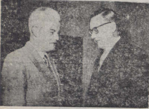
در عکس بالا آقای اشرف وزیر مختار سوئیس در ملاقات با آقای انتظام وزیر امور خارجه دیده می شود

موضوع اعزام سفیر کبیر ایران بلندن در جلسه امر و زهیت وزیران مطرح میگردد