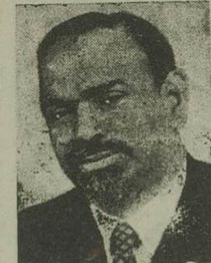
سردار پاکار سفیر هند در بکن

بقرار اطلاع دولت هندوستان ضمن یادداشت اخیر خود بولت چین خاطر نشان ساخته که در هر دو لاسا پایتخت تبت عده زیادی از بازرگانان هندی مقیم بوده و تأسیسات بزرگی دارند و طبق قرار داد جداگانه باید این قبه در دسترس سوم