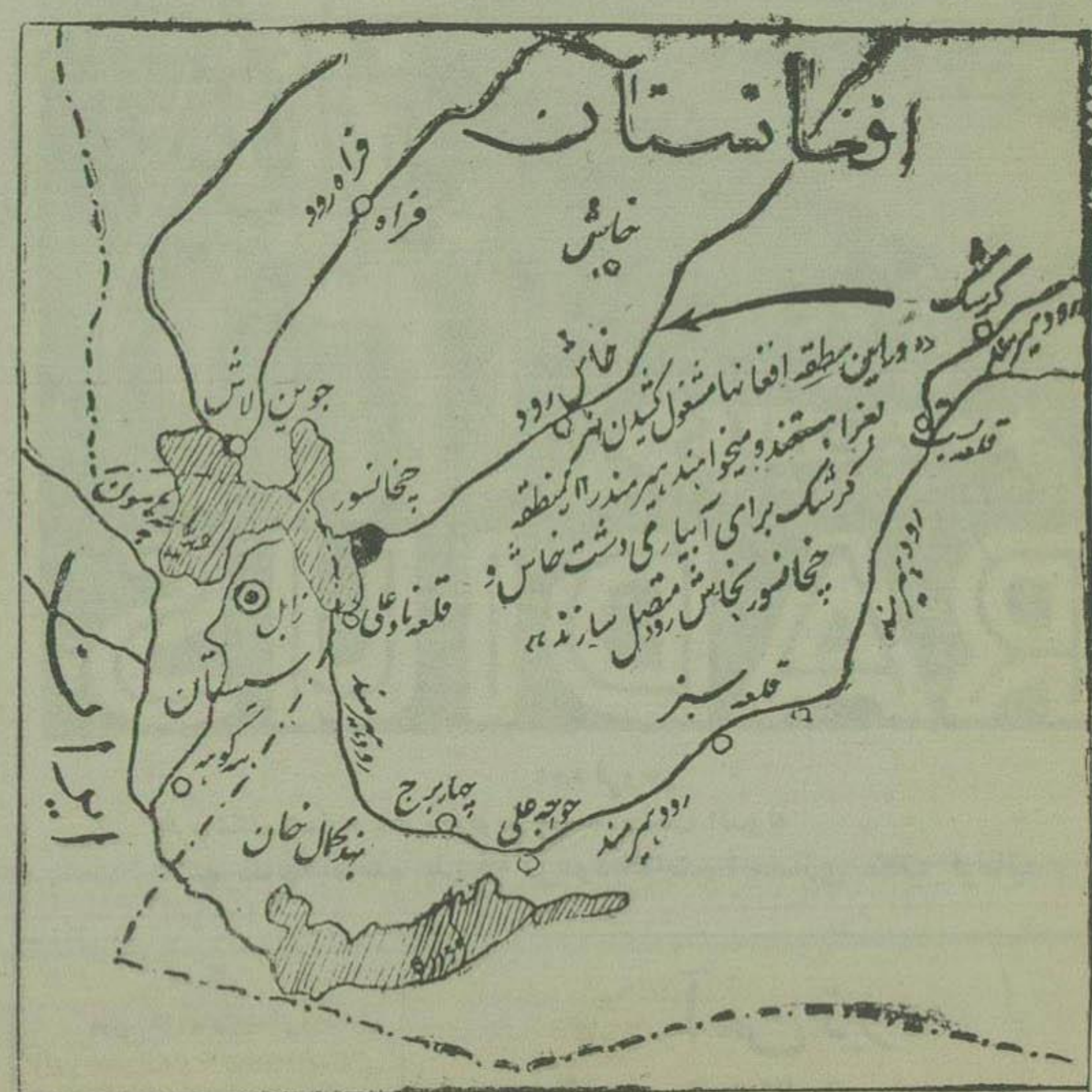
نقشه خیابان نهر بگرا