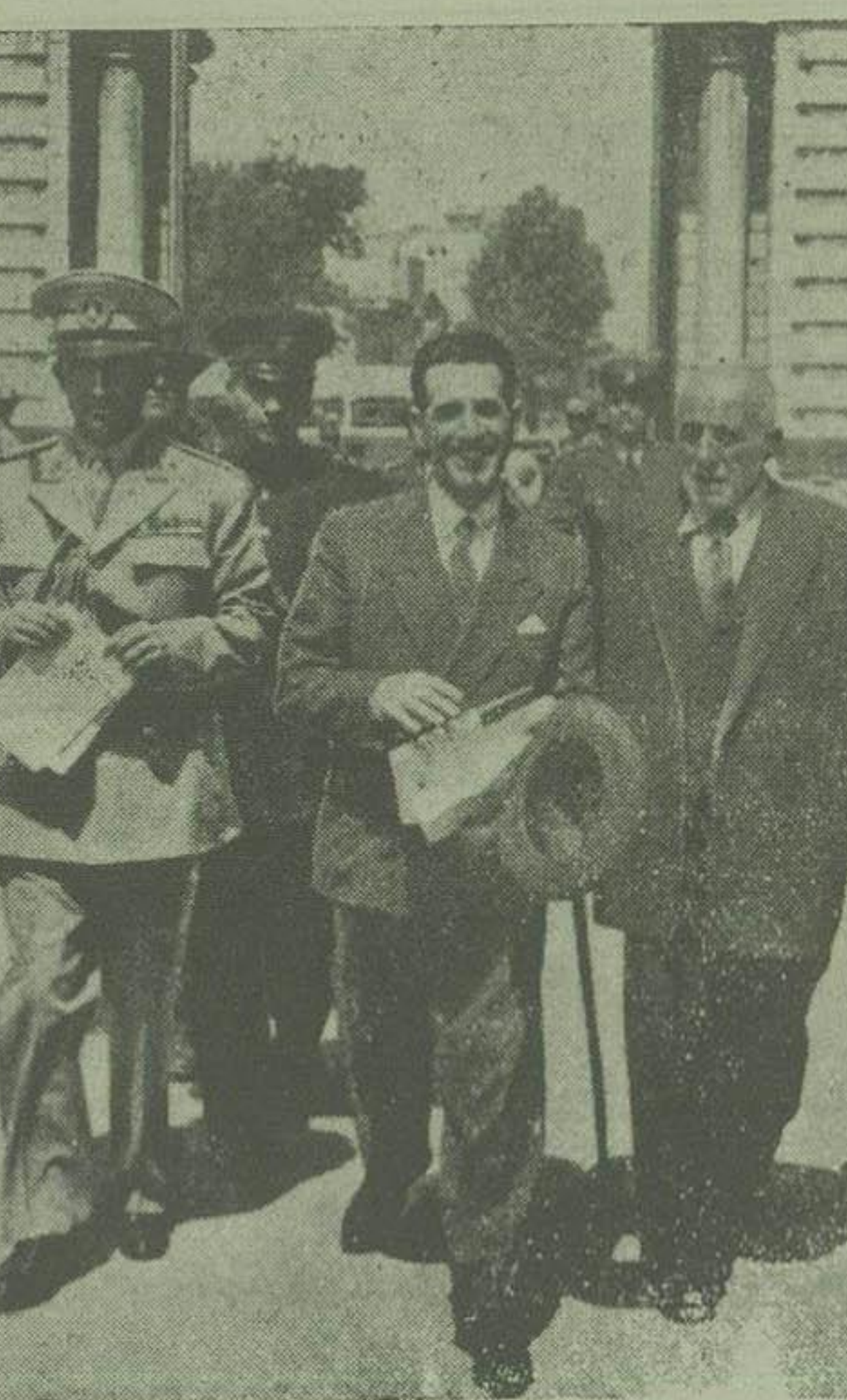
نخست وزیر با تفاتی وزیر جنگ خود برای انجام مراسم معرفی وارد مجلس میشوند