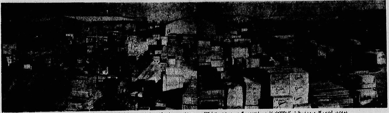
دولت بر آن است که واردات کالاهای خارجی را بعهده‌گیرد و بدین ترتیب تنها کالای مورد نیاز مردم وارد کشور خواهد شد.