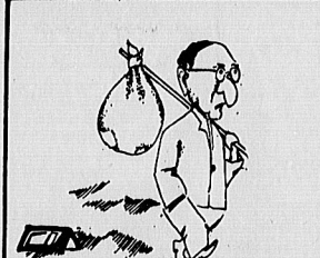
آئینه‌ها شکلات مردم