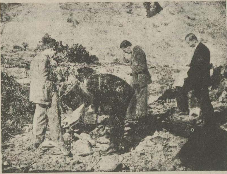
چند نفر از افراد هیئت امتهلی مصر هنگام بررسی در محل سقوط هواپیمای

اجساد پنجتن مصری و پنجتن آمریکائی مومیائی خواهد شد نخست وزیر نامه تسلیم آمیزی برای خانواده یکی از مقتولین حادثه هوائی فرستاده