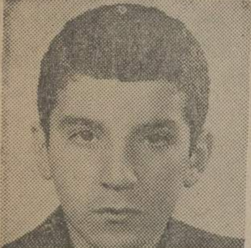
استنداد یک مادر

بناک ملی ایران دیوار های تکنیکی و سقف مخصوص دوباب اطاق عمل شش ضلعی بیمارستان سابق خود را که کلا ساخت فرانسه است از طریق مزایده بفروش می رساند . داوطلبان خرید می توانند با مراجعه بدایره تعیرات اداره ساختمان بانک واقع در خیابان فردوسی ، مورد مزایده را از نزدیک بازدید و در صورت تمایل بخریداری شرایط مزایده را از دایره مزبور دریافت و پس از افضاه ضمیمه پیشنهاد خود نموده و تا آخر ساعت اداری روز ۲۰، ۵۲، ۵۲هـ با اداره ساختمان بانک ملی واقع در خیابان سعدی جنوبی تسلیم نمایند .