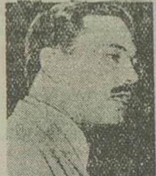
کمال الدین حسین وزیر فرهنگ مصر

مشکل را باندبیرات عملی خوش بر طرف راحویل جامعه خواهد داد ساخت و باهمان اعتبارات سابق که در ۳۰ درمراحل تعلیمات متوسطه و اختیار فرهنگ بود مصمم گردید سالی عالی نیز اصل تربیت کامل را رعایت گردید سیستم ساختمان دولتی برای مدارس احداث کند و اینکار هم با سرعت عجبی طی سال اول دو صد صورت گرفت و همین منوال در سالهای بعد عمل خواهد شد و کلیه مدارس دارای ساختمانهای بهداشتی متناسب خواهد گردید. ۲- تا چند سال پیش هدف مدرسه و تدریس تنها با سواد شدن نوجوانان بوده و مقصود از فرهنگ فقط تعلیم بیشتر بود و جنبه دوم فرهنگ عمومی که تربیت باشد یا مورد نظر بوده و با اساسا ضعیف و ناقص بوده است و حالا در نتیجه توجه خاصی