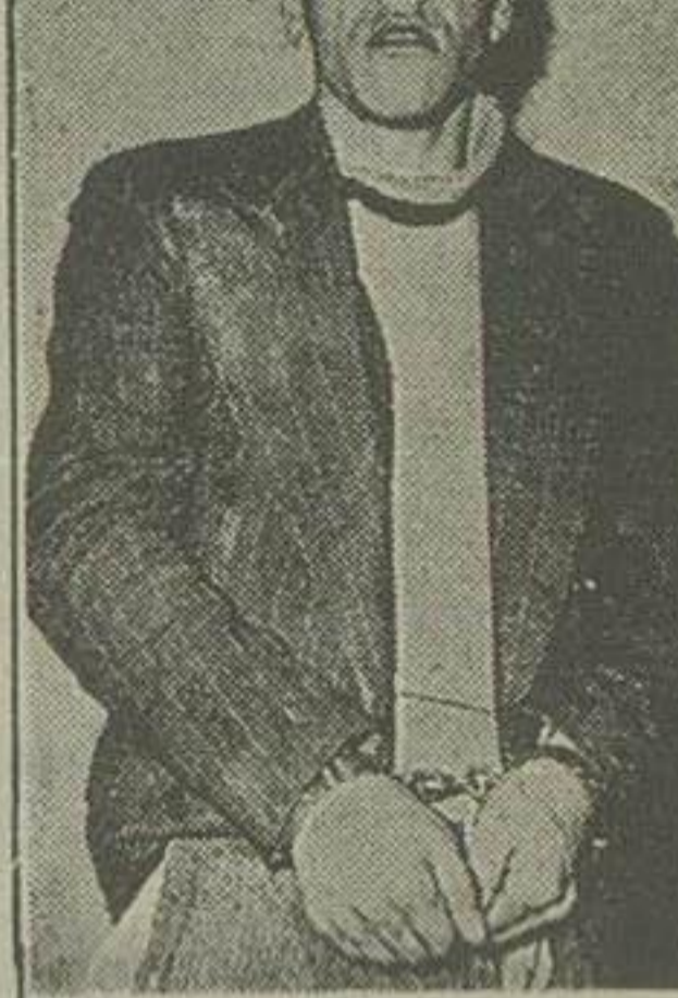
هدایت قاتل برادر خود