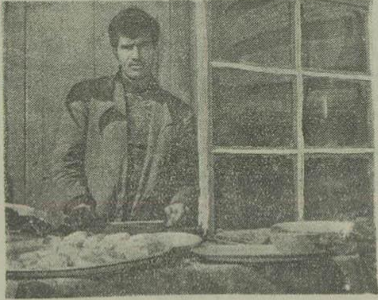
نصرت در ساط جگر فروشی خود