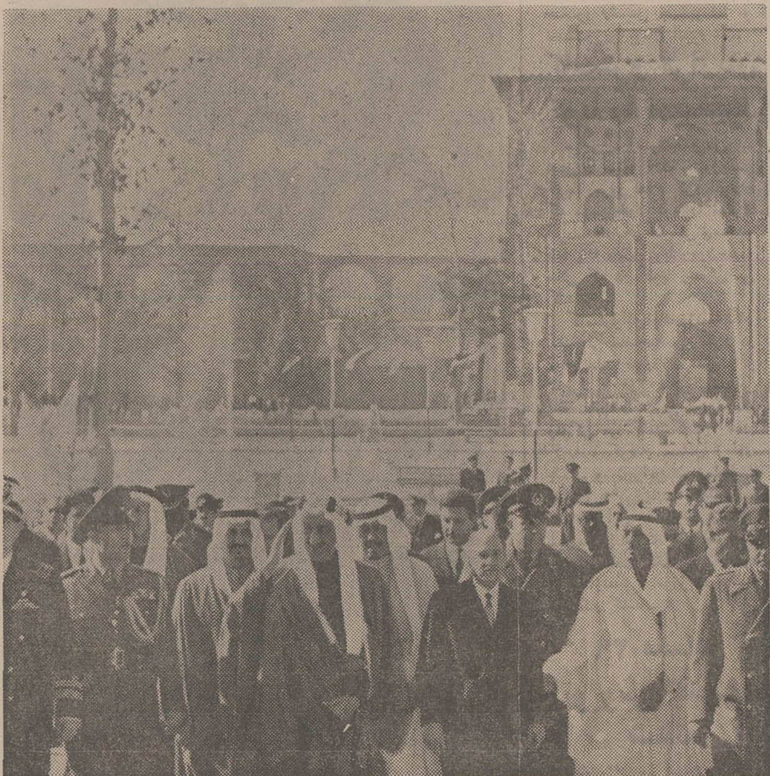
ملک فیصل پادشاه متوفای عربستان سعودی ضمن سفری کعبه ایران کرد از اصفهان نیز بازدید بعمل آورد. عکس پادشاه متوفای سعودی و همراهان وی را در میدان عالی قاپوی اصفهان نشان میدهد.

بغداد بلافاصله به نجف اشرف و کربلا و زیارت ائمه اطهار بود . بهمین نحو هم عمل شد نخست وزیر و همراهان یک و نیم بعد از ظهر با چند هلی کوپتر بطرف نجف اشرف پرواز کردند . مذاکرات قرار است هویدا عصر امروز به باهلی کوپتر به نجف اشرف و کربلا پرواز کرد، و بزیرایت مرید مطهر حضرت علی بن ابی طالب علیه السلام امام اول و حضرت سیدالشهدا امام حسین بن علی سرور شهیدان شفاعت . هویدا که بدعوت صدام حسین نایب رئیس شورای فرماندهی انقلاب و معاون رئیس جمهوری عراق به آن کشور سفر کرده است صبح امروز یک هواپیمای بوئینگ ۷۲۷ها از کیش پرواز کرد و ساعتی بعد وارد فرودگاه بین المللی بغداد شد. در فرودگاه صدام - حسین باطاق چند تن از وزرا و مقامات عالی رتبه دولتی و حزبی عراق از نخست وزیر ایران استقبال رسمی بعمل آورد. سراسر محوطه فرودگاه بغداد که با پرچم های ایران و عراق تزئین شده بود، شمارهای مینی پرچم خوش آمدگویی نصب شده بود . مردم عراق و کارکنان فرودگاه باالتهاب واحساسات گرم از نخست وزیر و همراهان ایرانی وی استقبال بعمل آوردند . نایب رئیس هویدا خارج از مقرات دیدار رسمی بصورت یک دیدار استثنائی باهیجان عمومی مردم بغداد روبرو شد . مردم در مسیر حرکت هویدا و هیئت همراهان با تکرار تهنیت های فراوان از فرودگاه تا قصر سلطنتی استقبال کردند .