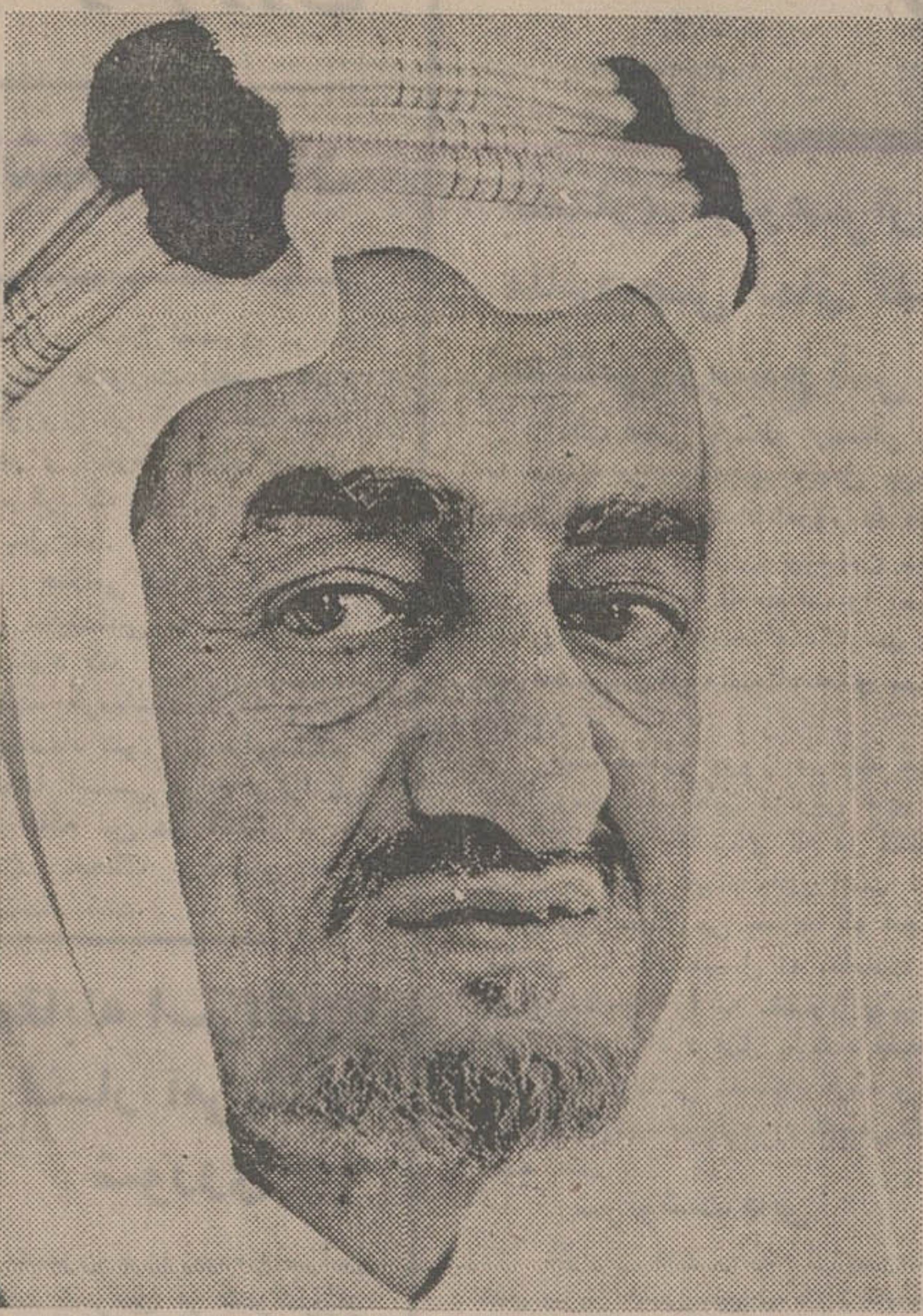
قتل ملک فیصل کلبه خیرهای سیاسی ومالی جهان را تحت الشعاع قرار داده است و مطبوعات جهان عکسهای مختلف از پادشاه قید عربستان را در شماره های امروز انتشار دادند.

* ارزش دلار و سهام شرکت‌های نفتی پائین آمد.