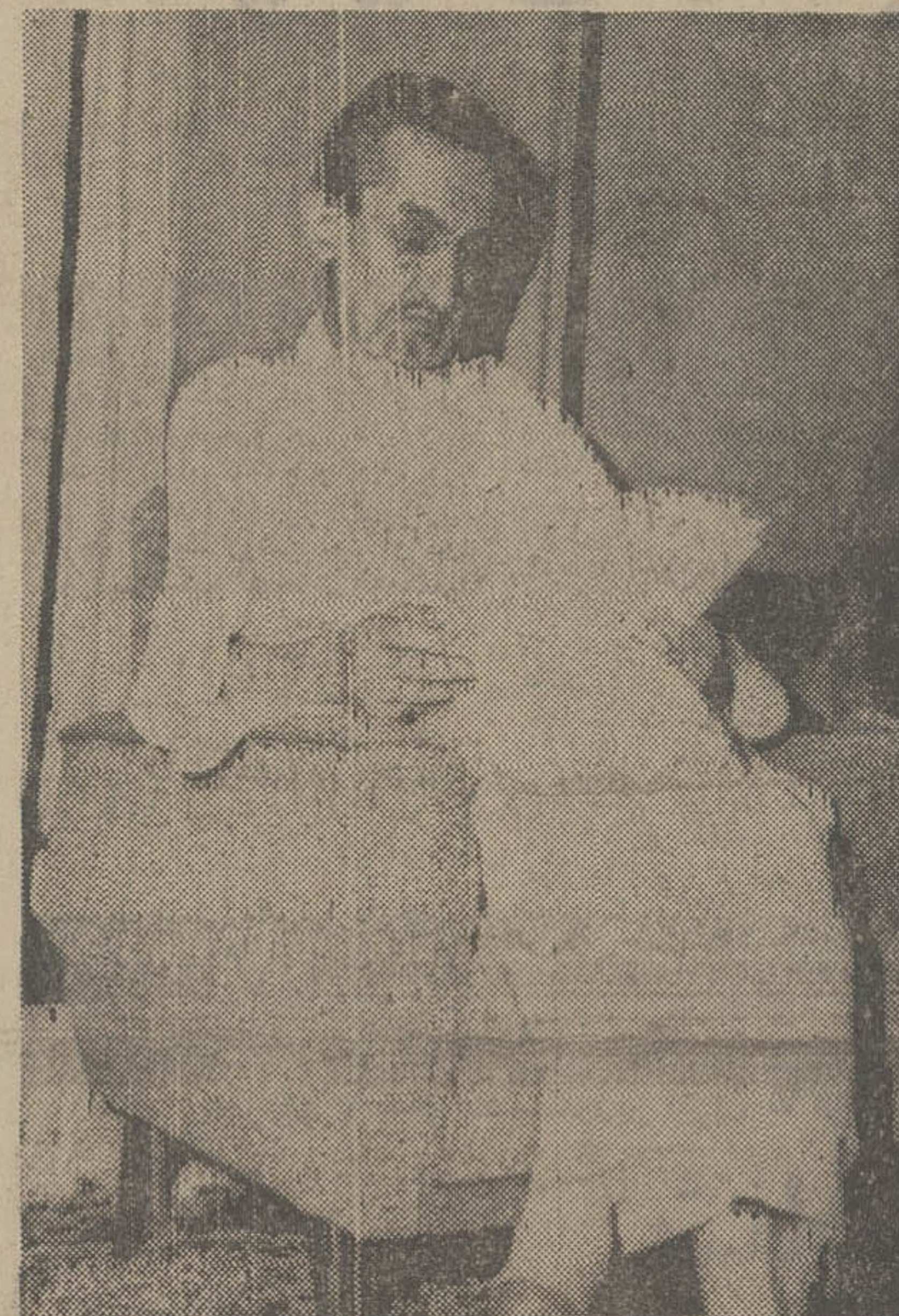
ملک فیصل، پادشاه فقید عربستان به شاعر اسلامی توجهی خاص داشت و در تمامی مراسم مذهبی ایران و اعتقادی استوار شرکت می‌جست. این عکس، در یک فیصل‌را در مکه معظمه، و به هنگامی نشان می‌دهد که وی خود را برای شرکت در مراسم حج آماده کرده بود. عکس: ملک فیصل‌راند لباس احرام نشان میدهد.

سفارت مشایخ فریدنی هم‌زمان بود. مشایخ درباره چگونگی خلع ملک سعود از سلطنت جدت‌تجدیر ادش: ملک فیصل - و سپس تاجگذاری سرزمین زاهد اسلام، یاد می‌آورد: «آغاز سلطنت فیصل، فصل تازه‌ای در روابط ایران و عربستان سعودی را نیز آغاز کرد. ملک فیصل، پس از رسیدن به اورنگ عربستان سعودی، اولین مسافرتی خارجی خود را در مقام پادشاهی ملکیتش، با سفر به ایران انجام داد. همین سفر که از اعتقاد و احترام پادشاه جدید عربستان نسبت به رهبران حکایت‌داشت، با اعتقاد من، مقدمه حل بسیاری از مشکلات و مسائل خاورمیانه - بویژه در خلیج فارس - بود و تحول دامن‌داری را در روابط ایران و عربستان سعودی، و بطور کلی دیگر اعراب، پدیدار ساخت.» سفیر سابق شاهنشاه آریامهر در عربستان سعودی، درباره پادشاه