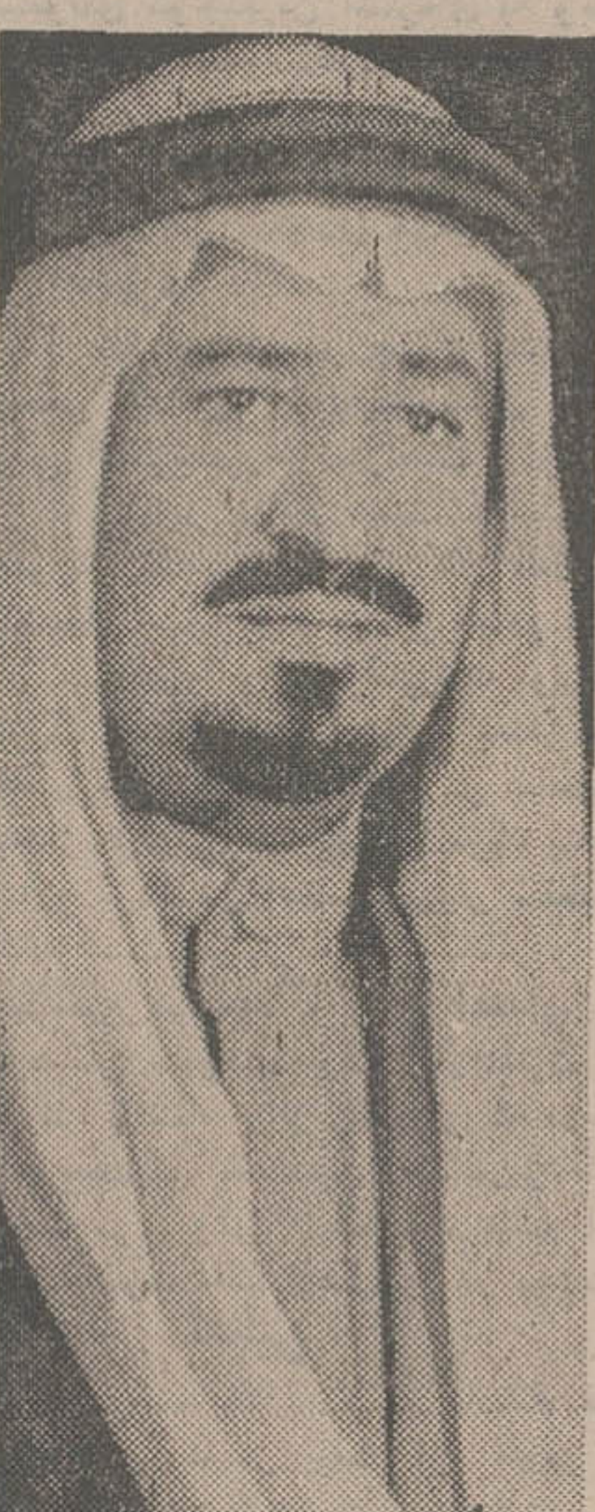
ملک خالد بن عبدالعزیز برادر ملک فیصل پادشاه قید عربستان که پرویز بی از درگذشت پادشاه بعنوان پادشاه جدید این کشور اعلام شد.

جناب آقای دکتر نیک‌پی شهردار محبوب پایتخت سالیکه گذشت شهر تهران و اهالی آن شاهدو ناظر فعالیت‌های خستگی‌ناپذیر آن شهردار معظم بودند. امید است سالی را که در پیش داریم و بحق باید وجه تسمیه آنرا سال رستاخیز ملی گذاریم سال برکت و موفقیت آمیزی برای آن جناب باشد. صنف بافروشی و توزیع کنندگان میوه مفتخر است ضمن عرض تبریک نوروزی جانشانی کلبه اعضای خود را جهت بشهر رساندن منویات عالییه شاهنشاه آریامهر در معیت آن جناب که یکی از شایسته‌ترین سربازان انقلاب سفید میباشد اعلام دارد صفا زاده