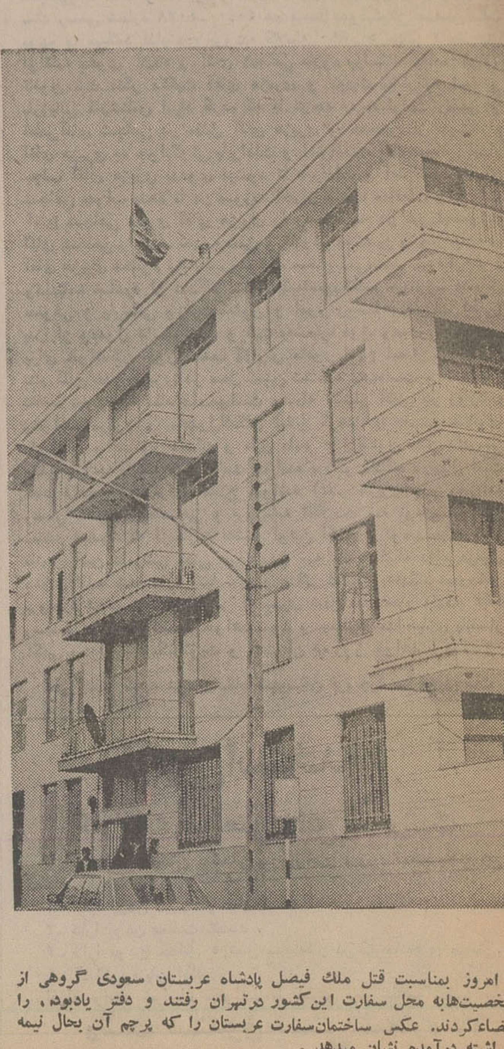
امروز بمناسبت قتل ملک فیصل پادشاه عربستان سعودی گروهی از شخصیتها به محل سفارت این کشور در تهران رفتند و دفتر یادبود ، را افراشته کردند . عکس ساختمان سفارت عربستان را که پرچم آن بحال نیمه افراشته درآمده نشان میدهد .