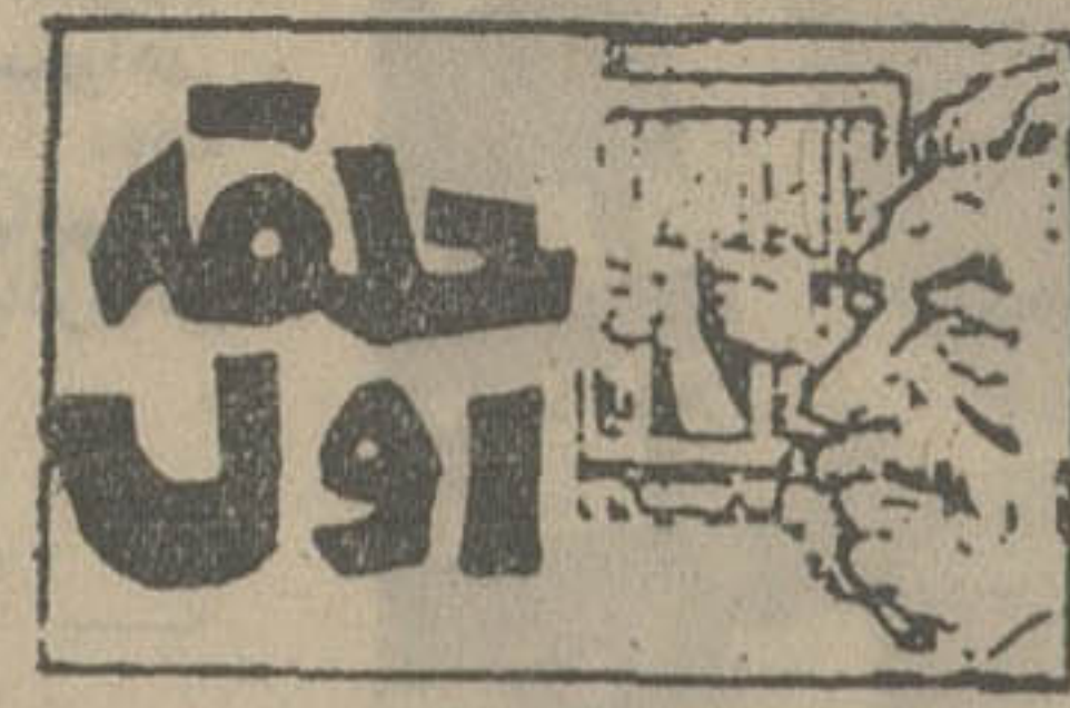
نوشته: لکساندر سولز نیت سین ترجمه: ناصر خطیر