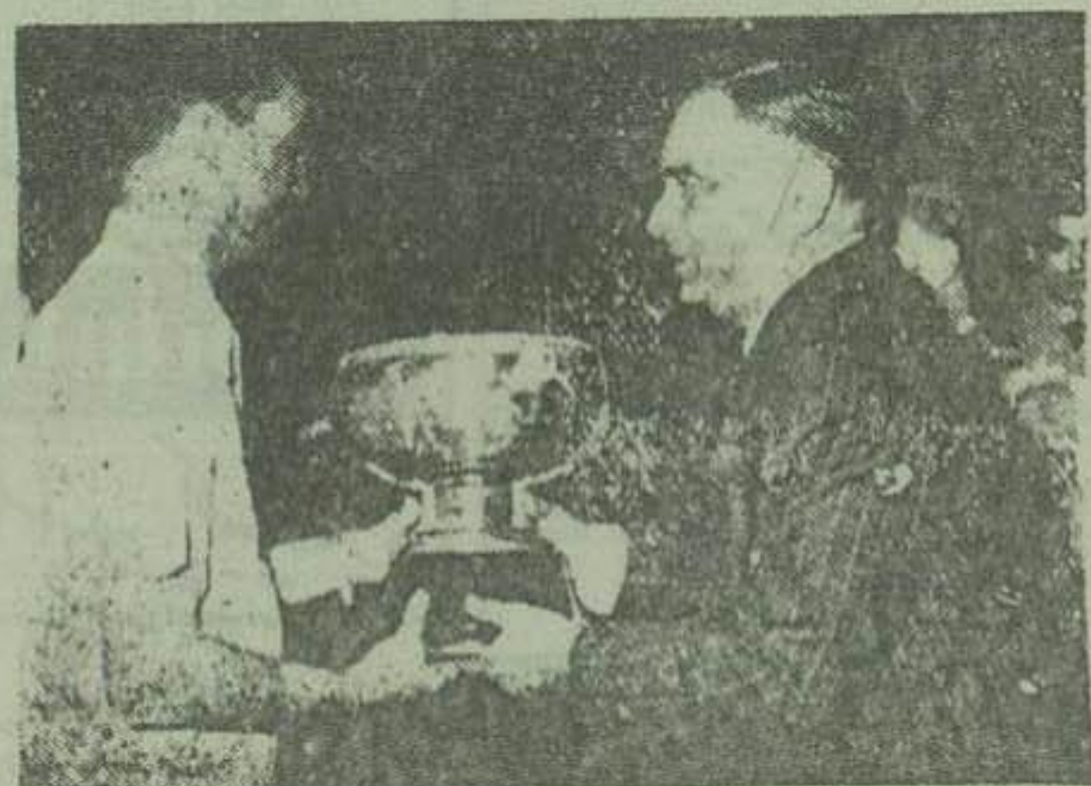
رئیس جمهوری کلدان نقره را بر سر پرست تیم فوتبال ارتش ایران اهدا کردند

ساعت سیصد از ظهر دیروز مسابقه میبجی بین تیم فوتبال ارتش شاهنشاهی و تیم فوتبال ارتش پاکستان در پیشگاه شاهنشاه و حضرت رئیس جمهور انجام شد. والا حضرت شاهپور غلامرضا و لاجنرت شاهپور عبدالرشاد و چند تن از آقایان وزراء نیز در التزام رقابت مایل بودند. شاهنشاه و حضرت اسکندر میرزا بزرگ ساعت سه بعد از ظهر با ستادوم امجدیه تشریف فرما شدند و قبل از رفتن بیجاک معوضی دستموزیک احترامات نظامی را انجام داد و رئیس تیم در صفحه هفتم