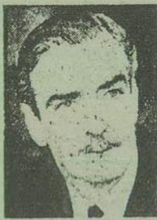
سر آسوتی آیدن

لندن - روتیر - در محافل سیاسی لندن گفته میشود که در نتیجه اختلافات که وجود اختلاف در کابینه انگلیس بر سر عقیده حمله بمصر و فرمان آتش بس ایجاد کرده موقعت آسوتی آیدن فوق العاده متزلزل گردیده است. اگرچه شب گذشته یک منبع نیم رسمی شایعات مبنی بر شکاف مهم و روش مناسب و صحیح است که باید عمده در کابینه انگلیس را تکذیب