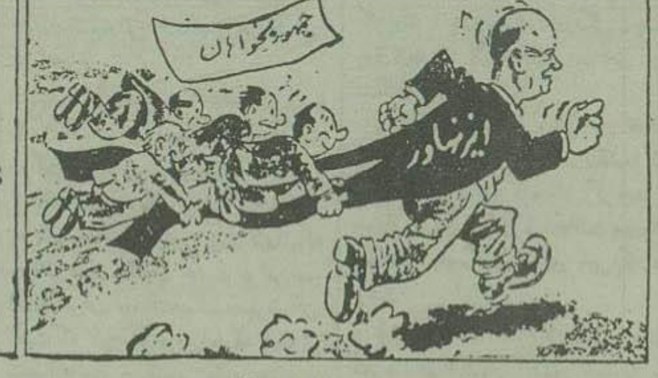
حران انتقادات آخر امریکا کارنگار است «دویدرک تایمز» درین ده کارنگار تشریح نموده است