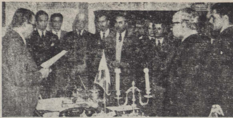
آقای انتظام وزیر امور خارجه هنگام قرائت اعلامیه در جلسه مصاحبه مطبوعاتی امروز در وزارت خارجه