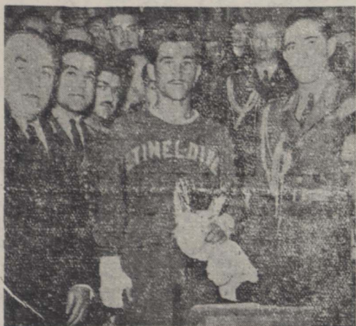
پس از معرفی قهرمانان ترک جایزه حقی کون دوغودی قهرمان ترک بوسیله والا حضرت شاپور علی رضا بنامبرده اعطاش

شب پنجشنبه هفتم آبان دومین مسابقه بوکس بین قهرمانان ایران و ترک انجام گرفت مقادیر ساعت هفت و ده از ظهر والا حضرت شاپور علی رضا در میان ایراد احساسات حمیت وارد سان شد و در جایگاه مخصوص قرار گرفت ابتدا آقای تیم غیر مقدم گفت سپس آقای سرهنک خسروانی مدیر باشگاه تاج فعالیت های باشگاه را در مدت ۸ سال بیان کرد آنگاه پس از کسب اجازه از والا حضرت قهرمانان دو تیم با سرپرستان خود وارد رینگ بوکس شدند و مراسم معرفی بصل آمد از طرف قهرمانان ترک و ایراد هدایای رد و بدل شد و مسابقه آغاز گردید. نتیجه مسابقه بدین قرار بود: در وزن اول آقای ایلخانوف با حاکیم آلتاش بنفم ایلخانوف در وزن دوم بین وسائلی با ساری آلتاش بنفم رسائلی در قبه درصه چهارم