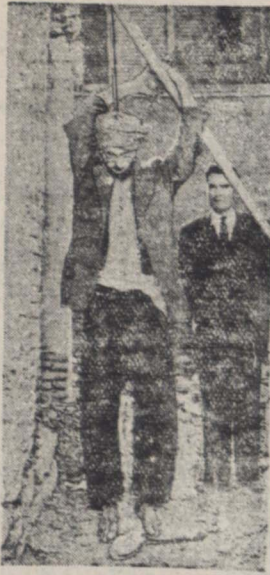
صبح روز پنجشنبه ناگهان کسب خیابان پهلوی متوجه شدند که مدعی پادشاه بوسه ملایمی که زیر کلاه انداخته خود را به تیری که پیکر آنرا در دیوار کاداره و سردیگر ادواری صندوق خالی جوی قرار داده است آویزان نموده و بی حرکت مانده است...