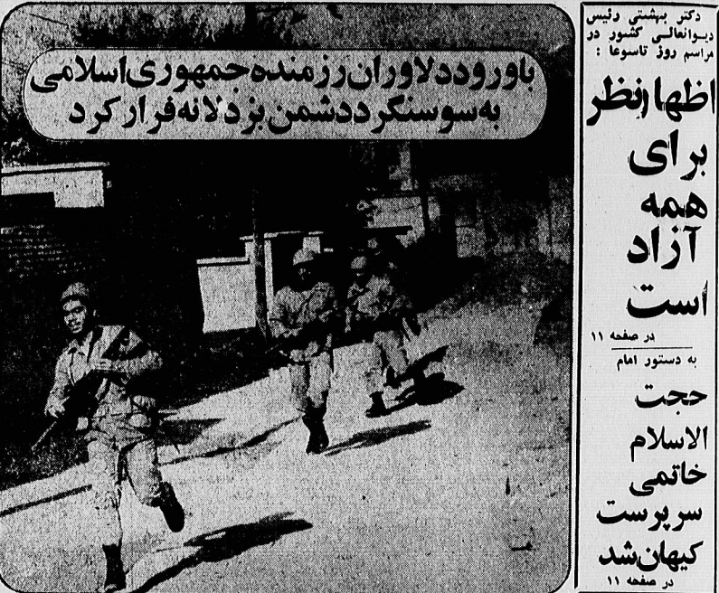
باور و دلوران رزمندگان جمهوری اسلامی به سوسنگرد دشمن بزدلانه فرار کرد

ملت ما حاضر نیست شرایط دولت صدام را بپذیرد