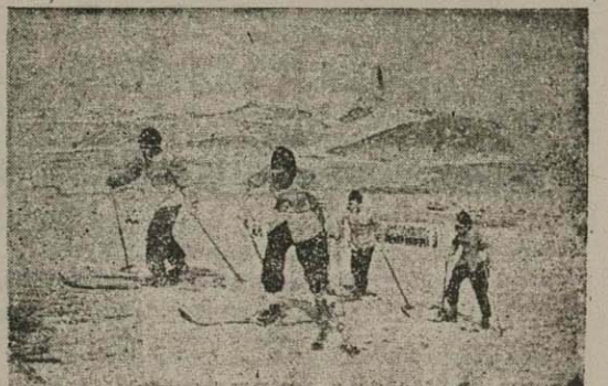
چند تن از اسکی بازان لشکر اول هنگ کم انجام مسابقه سرعت و عظمت در شب در لشکرک

مجلس سوسیالیست در یونان مایل است هر چه زودتر کار خود را تمام کند - مجلس ملی ترکیه عهدنامه ترکیه و ماوراء اردن را تصویب کرده و هنگامی که عهدنامه مزبور مطرح بود حسن سقا وزیر خارجه ترکیه گفت : دولت ترکیه مایل است با کلیه کشورهای جهان چنین قراردادی منعقد نماید