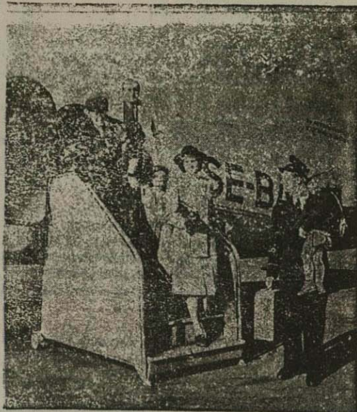
عدهای از مسافری خط هوایی سوئدی، دریکی از فرودگاههای این خط، پیاده میشوند.