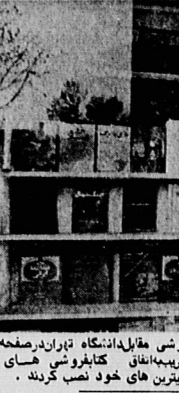
در یکی از روزهای حمله به کتابفروشی‌ها در تهران

دفتر نخست‌وزیری برای رسیدگی به وقایع حمله به کتابفروشی فول رسدگی سریع داد.