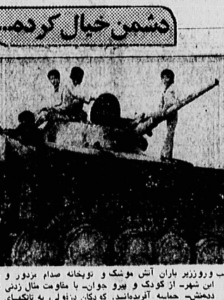
شهر تبریز، دزفول، سن و روزی باران آتش موکب و توپخانه صدام بزور و خاشاک فرار دارد. اما مردم دشمن، حمله آترویدمانند، کوکدان دزفول، به ناکهای عراقی به گونه آسایبازیه

متأسفانه بعلت نقص فنی در قسمت برق، انتشار کپی به تاخیر افتاد بسمه تعالی اطلاعیه شماره ۵ قابل توجه فروشندهگان لوازم منزل در صفحه آخر