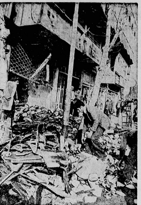
بخان کتابفروشی‌ها حمله با مواد آتش‌زا مورد حمله قرار گرفته است

در این فتنه‌ها که در تهران و سایر شهرها در جریان است، هدف دشمن ایجاد آشوب و ناآرامی در کشور است.