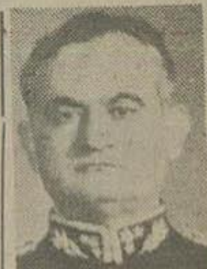
عصر دیروز خیر نگار اداره با آقای سرلشکر بهارست رئیس ستاد ارتش مصاحبه می نمود شرح زیر بعمل آورد.

ابتدا سؤال شد نظر شما نسبت باصلاح دستگاه ارتش چیست؟