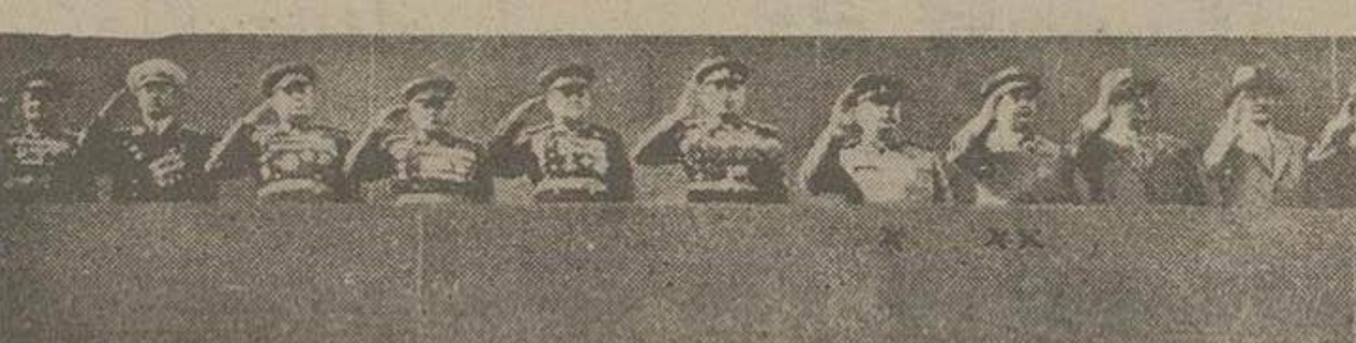
اعضای پولیت بورو هنگام رژه ارتش شوروی در میدان سرخ ژنرال ایسم استالین با علامت (X) و هالنتک نامزد جانشینی وی با (X) مشخص میباشد

سیاستمداران واشنگتن فرمان تشکیل کنگره عمومی حزب کمونیست شوروی را با اهمیت خاصی تلقی کرده و معتقدند ماه آینده سر نوشت صلح یا جنگ در مسکو تعیین خواهد شد هلق و خصومت دامنه داری که در بین اعضای پولیت بورو بوجود آمده، انحلال هیئت رئیسه شورایی اتحاد جماهیر شوروی را ایجاب میکند استالین قصد دارد زمام شوروی را به عنصر جوانتری واگذار کند