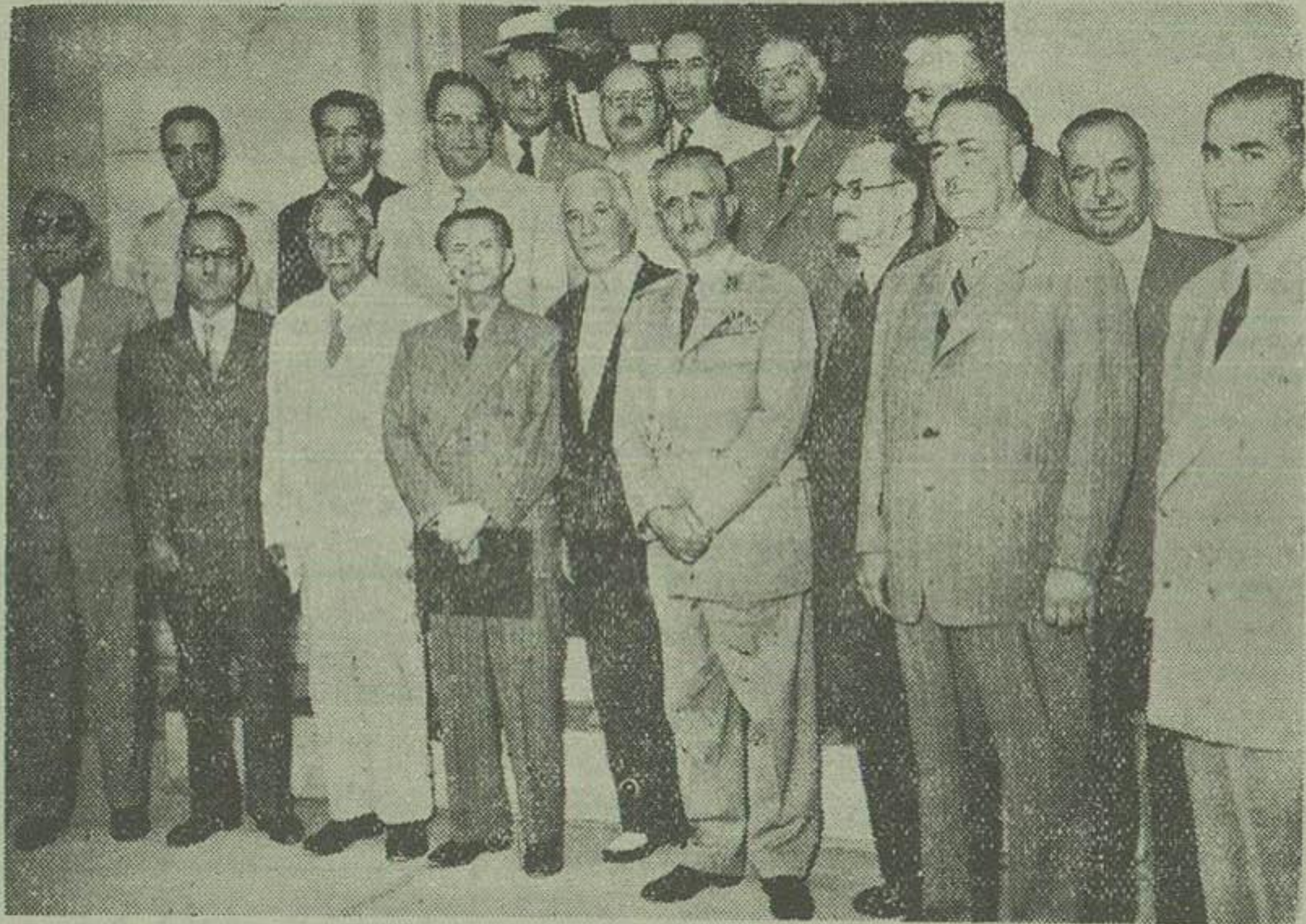
اعضای هیئت مدیره نگاه حمایت مادران و نوزادان در اجتماعات مجلس عمومی در کاخ مرمر دیده میشوند

وزیر دربار در طبق افتتاحیه گفت: اقدامات و عملیات این موسسات عام المنفعه مورد رضایت عموم میباشد و توجه مخصوص اعلیحضرت همایونی و علیاحضرت ملکه ثریا باین موسسه سالیانه و انتظار دارند که برنامه های وسیع و مفصلا تری از نظر حمایت مادر و نوزادان هر حمله عمل گذاشته شود وزیر کشاورزی و سرپرست سازمان برنامه پیشنهاد کرد از فروش هر کیسه میمان که دوریال برای انجمن آثار ملی اخذ میگردد بگریال آن بازدهاد درآمد نگاه اختصاص داده شود