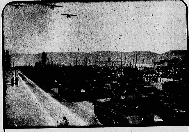
ترکیه از متحدان نزدیک آمریکا در پیمان «اتانو» است. قسمتی از نیروهای ترکیه عصر این پیمان را در عسک می بینیم.

کانون کانون صاحب امتیاز: حسین مطیعی سردبیر: سالیقی اولین شماره: اول فروردین ۱۳۱۷