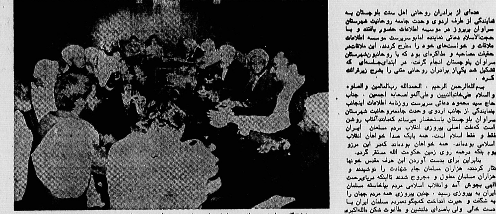
میدانگاه جامعه روحانیت سران بلوچستان در ملاقات با هیئت اسلامی دینی نماینده امام خمینی در اطلاعات

معدای از برادران روحانی اهل سنت بلوچستان به هایتی از طرف اردوی رحمت نامه روحانیت هیرستان سران پرویدی موسسه اطلاعات حضور یافتند و با حضور روحانیت اهل سنت بلوچستان در ملاقات با هیئت اسلامی دینی نماینده امام خمینی در اطلاعات