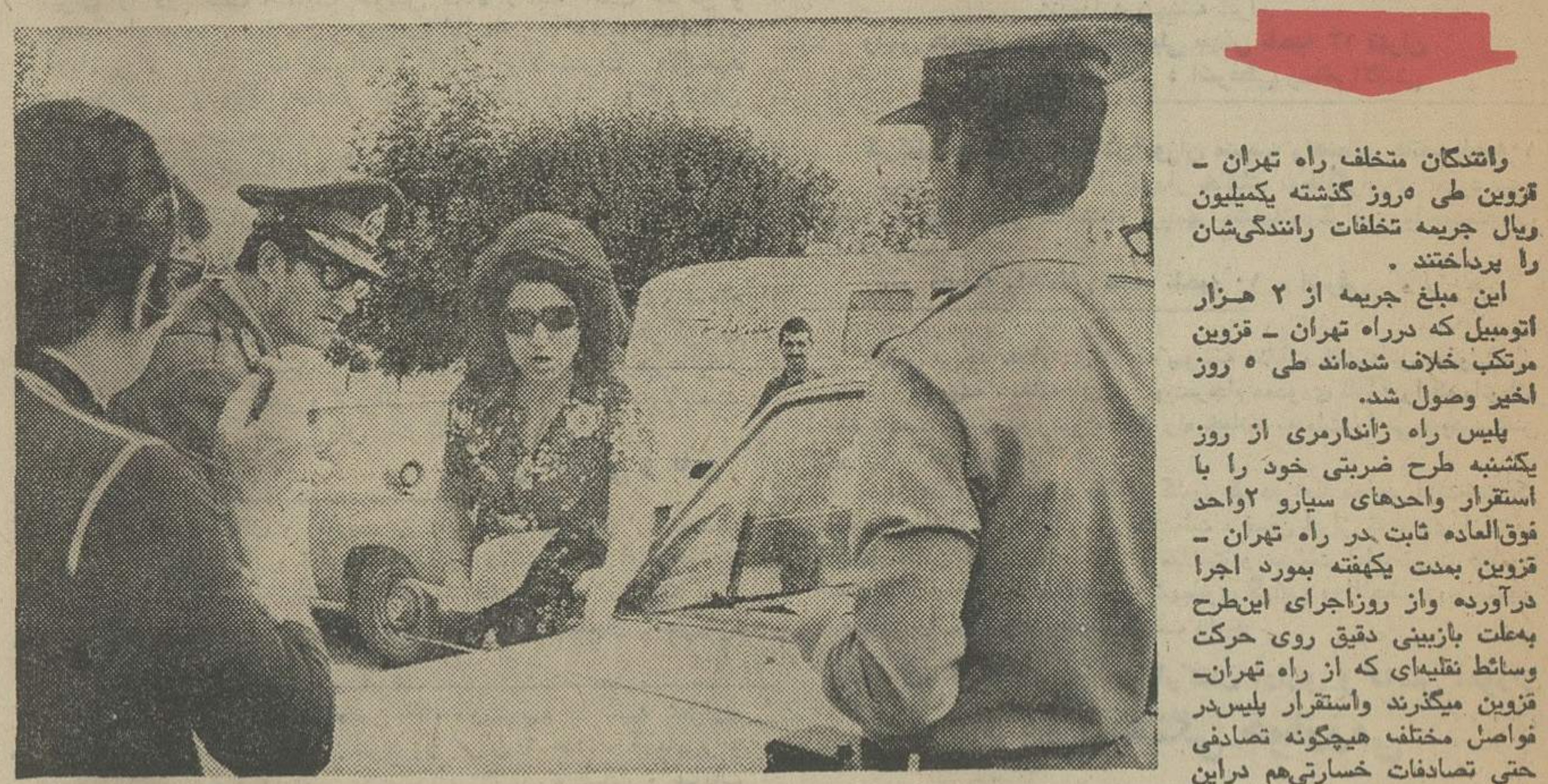
در این عکس که دیروز در راه قزوین برداشته شده است معاون پلیس راه ژاندارمری کارت مشخصاتیک راننده اتومبیل را بازبینی میکند.