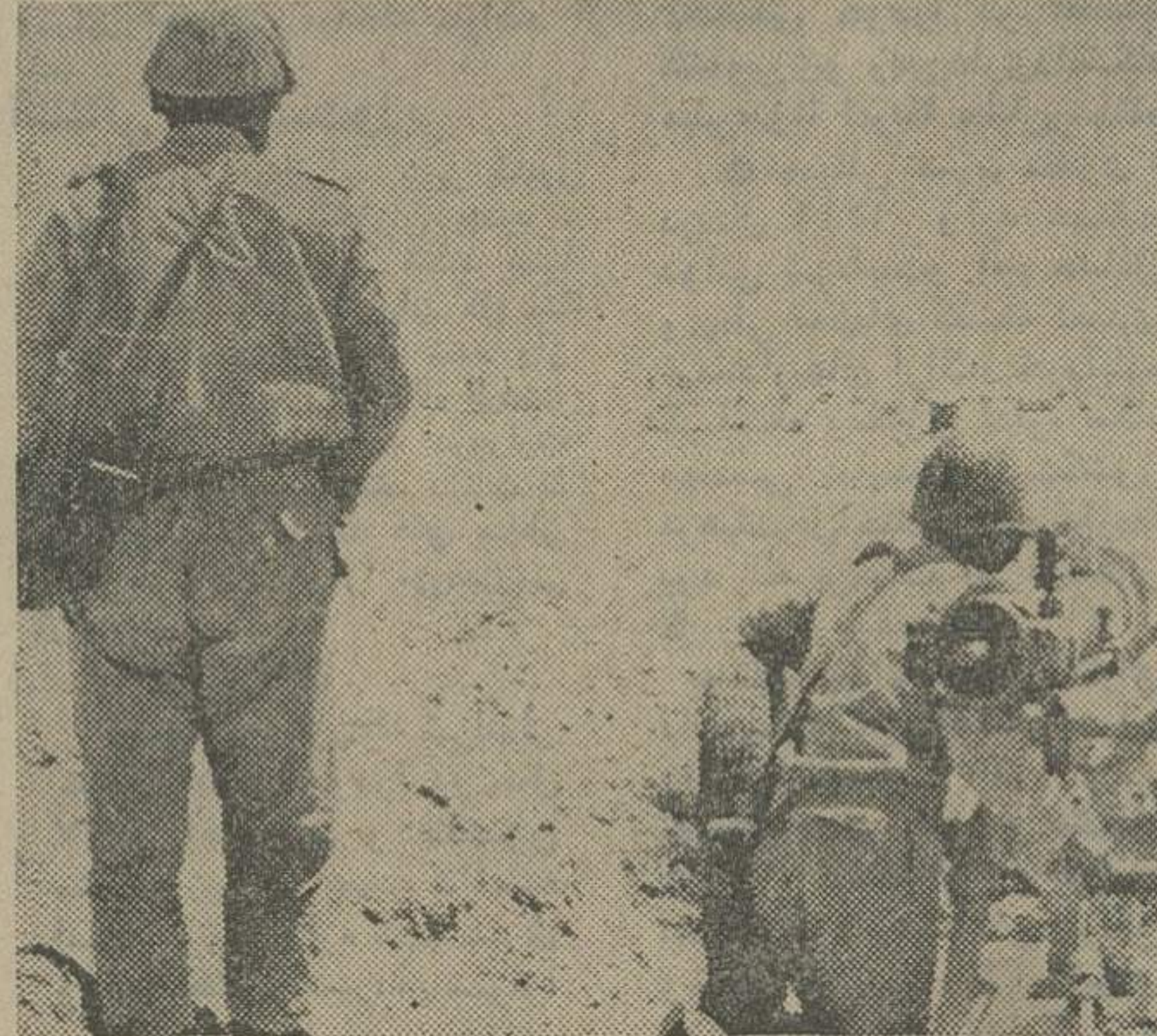
طی روز های اخیر بویژه ۲۴ ساعت گذشته اوضاع در جبهه های جنگ اعراب و اسرائیل بدست بحرانی بود و طرفین که گویي خواهد زد، همین حال خود را بحال آماده باش کامل در آورده بودند ، آماده باشی که بعد از ظهر دیروز سیمانکن ها، توب ها و تانک ها را به غرض در آورده

عمان - رویت - در جلسه فوق العاده ای کابینه اردن که با حضور ملکه حسین و فرماندهان نظامی اردن تشکیل شد پادشاه اردن از فرماندهی کل قوا درخواست کرد که کلیه نیرو های نظامی این کشور را بحال آماده باش درآورد. ملکه حسین سپس با انورسادات و حافظ اسد تلفنی صحبت کرد . از طرف دیگر ملکه فیصل پیامی بعنوان پزیدنت سادات و ژنرال حافظ اسد فرستاده برای نیروهای و کشور آزادی پیروزی کامل کرده است . ملکه فیصل در پیام خود اطمینان داده است که عربستان سعودی با تمام قدرت خود در کنار دو کشور برادر خواهد بود. ملکه فیصل گفته است ارتش عربستان حاضر است وارد جنگ شود .