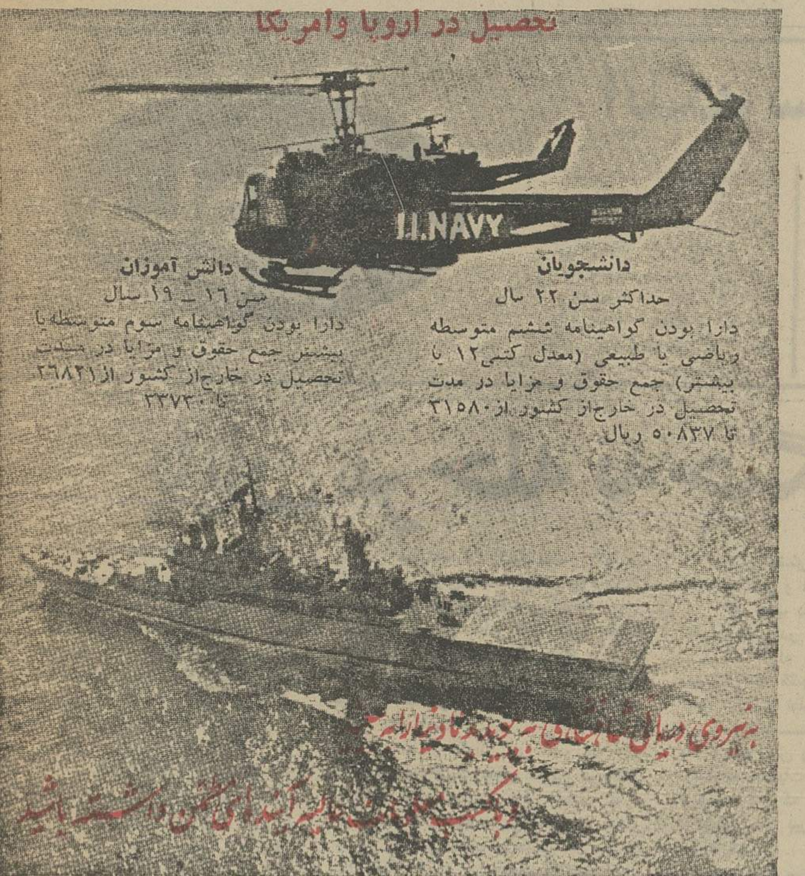
برای کسب اطلاع بیشتر به ستاد نیروی دریایی شاهنشاهی مراجعه فرمائید

با گرانفروشی وارد می آید . دولت پس از مطالعات زیاد و بررسی طل ناگامی مبارزه های مربوط بگرانفروشی قانون نظام صنفی را کتبی آن فرت انبشهای برای اتخاذ تصمیمات لازم در مورد این قبیل اقدامات بوجود می آید ، تدوین کرد و بوجوب این قانون هیئت عالی نظارت تحت عنوان مرکز تصمصم گیرنده در کنار اتاق اصناف تشکیل گردیده و کاری را که در این باره باید انجام گیرد این هیئت تعیین و تصمصم می نماید . مقامات مسئول وزارت کشور اعلام کردند که مبارزه با گرانفروشی بوسیله اتاق اصناف است و اتاقهای اصناف در شهرهای ایران صورت میگیرد ولی دستور کار اتاقها چه در تهران و چه در شهرستانها اعم از مبارزه با گرانفروشی ، تعیین نرخ ، تصمصم مقررات مربوط به امور پیشهوران جنگلی در هیئت عالی نظارت که با شرکت وزیران کشور ، کشاورزی ، تعاون و امور روستاها ، شهردار تهران ، رئیس شهربانی ، رئیس انجن شهر و چندین آزروسای اصناف در صورت لزوم تشکیل گردیده و تصمیمات لازم را اتخاذ مینماید . این تصمیمات با تصمصمات سایر اتاق اصناف پایتخت مورد ازمهم مبارزه با گرانفروشی اظهار نظر کرد و گفت : مبارزه با گرانفروشی بایسد بوسیله همه افراد مردم و ضمن همکاری آنها با ماموران صورت گیرد . شهردار در محل باید اذیت شد که بموجب مقررات قانون نظام صنفی امر مبارزه با گرانفروشی و تعیین نرخ و اجرای ضوابط مربوط باین کار دیگر با شهرداری نیست و این سازمان در این مورد مسئولیتی ندارد . بقیه در صفحه ۱۴