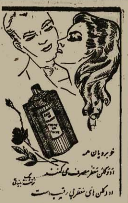
خوبه بان مر از رنگ آبی شترابی ریب است

بطلان و عدم نفوذ قرارداد ۱۹۳۳ راجع به امتیازی امتیاز ۱۹۳۳ در شماره ۳۸۰ درج شده مقاله مفصلی که حاوی مباحث بنیادین بود درج کردیم این که در تصمیم آن اجده امر صوری است امتیازی امتیاز ۱۹۳۳ را مورد بحث قرار دادیم امتیاز ۱۹۳۳ هم از لحاظ قرارداد باطل و هم از لحاظ قرارداد غیر نافذ تلقی می شود.