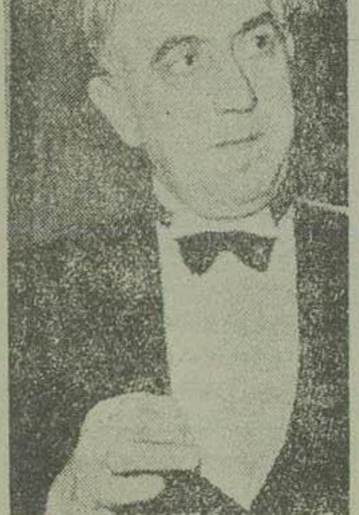
رویتر شهردار برلین باختری

امروز با تعداد ستاد ژنرال مک ارتور در توکیو سقوط بندر «کیبو» را رسیا اعلام کرد و ضمیمه اضافه کرد که سر بازان امریکایی با سرعت هرچه تمایز زیر آتش توپخانه دشمن بمباران شهر سئول پیشروی میکنند.