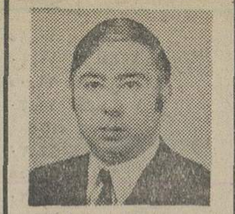
نوشته: دکتر منوچهر کیانی استاد دانشگاه تهران