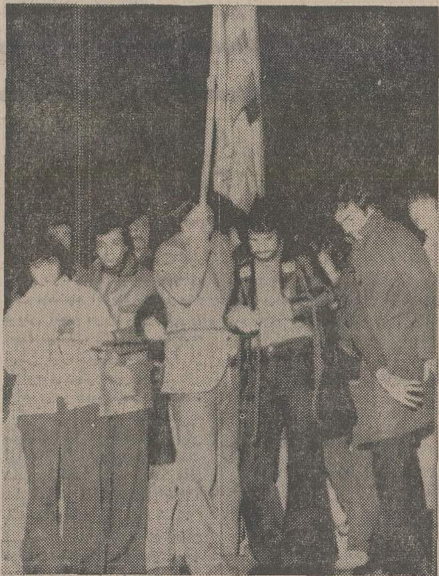
بدنیال اعلام حکومت جداگانه جمهوری در منطقه ترک نشین قبرس، در آتن نیز تظاهراتی از طرف جوانان یونانی برپا شد که در آن به اقدام ترکها شدیداً اعتراض شد.

آتن - رويتر - خبرگزاری فرانسه - ترکهای قبرس در منطقه تحت تسلط خود یک جمهوری خودمختار ترک تشکیل دادند و دولت ترکهای قبرس منطقه ترک نشین شمال جزیره را جمهوری فدرال قبرس اعلام کردند. اعلامیه‌ای که از رادیو آتکارا انتشار یافت گفته شده است که هدف نهایی از اعلام جمهوری فدرال قبرس حفظ اتحاد با جامعه یونانی قبرس در یک سیستم فدرالیتر اساس دو منطقه جغرافیایی است. سعیدی ایرماک نخست وزیر ترکهای قبرس یک طبقه رادیکالی را اعلام داشت فدرال را تصویب کرده‌اند. دولت خودمختار را یک کشور فدرال تبدیل کنند. این تصمیمی است که ملت ترک قبرس گرفته است و تا آنجا که مربوط به دولت ترک می‌باشد این تصمیم را محترم خواهد شمرد. امیدوارم که همه کشور های دیگر جهان نیز همین حسن نیت را نشان خواهند داد.