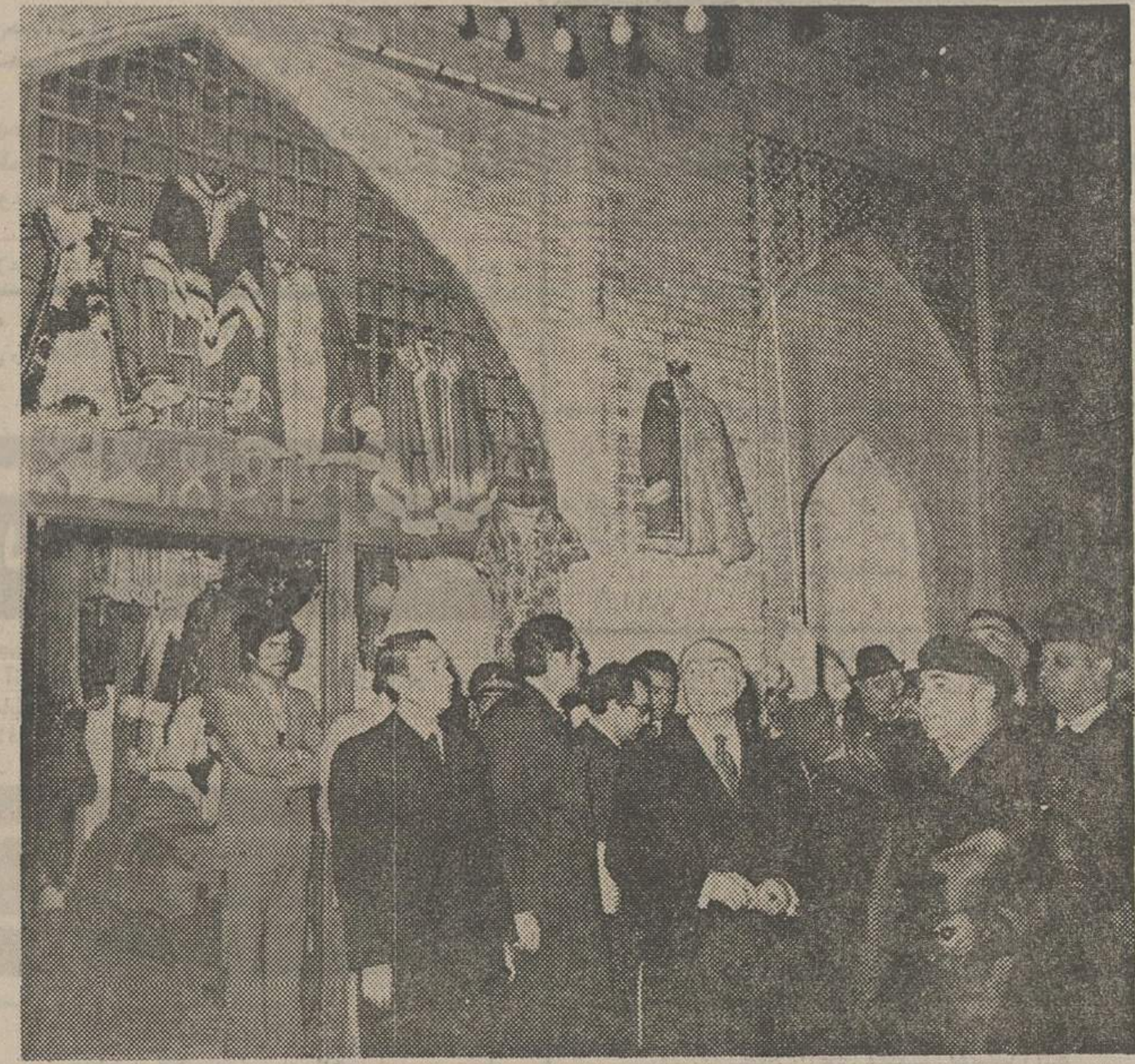
هویدا به اتفاق همراهان، استاندار و مقامات محلی اصفهان دیدن کرد و با کسبه این بازار به گفتگو پرداخت

شاهنشاه معلم را معماران ایران فردا خوانده اند