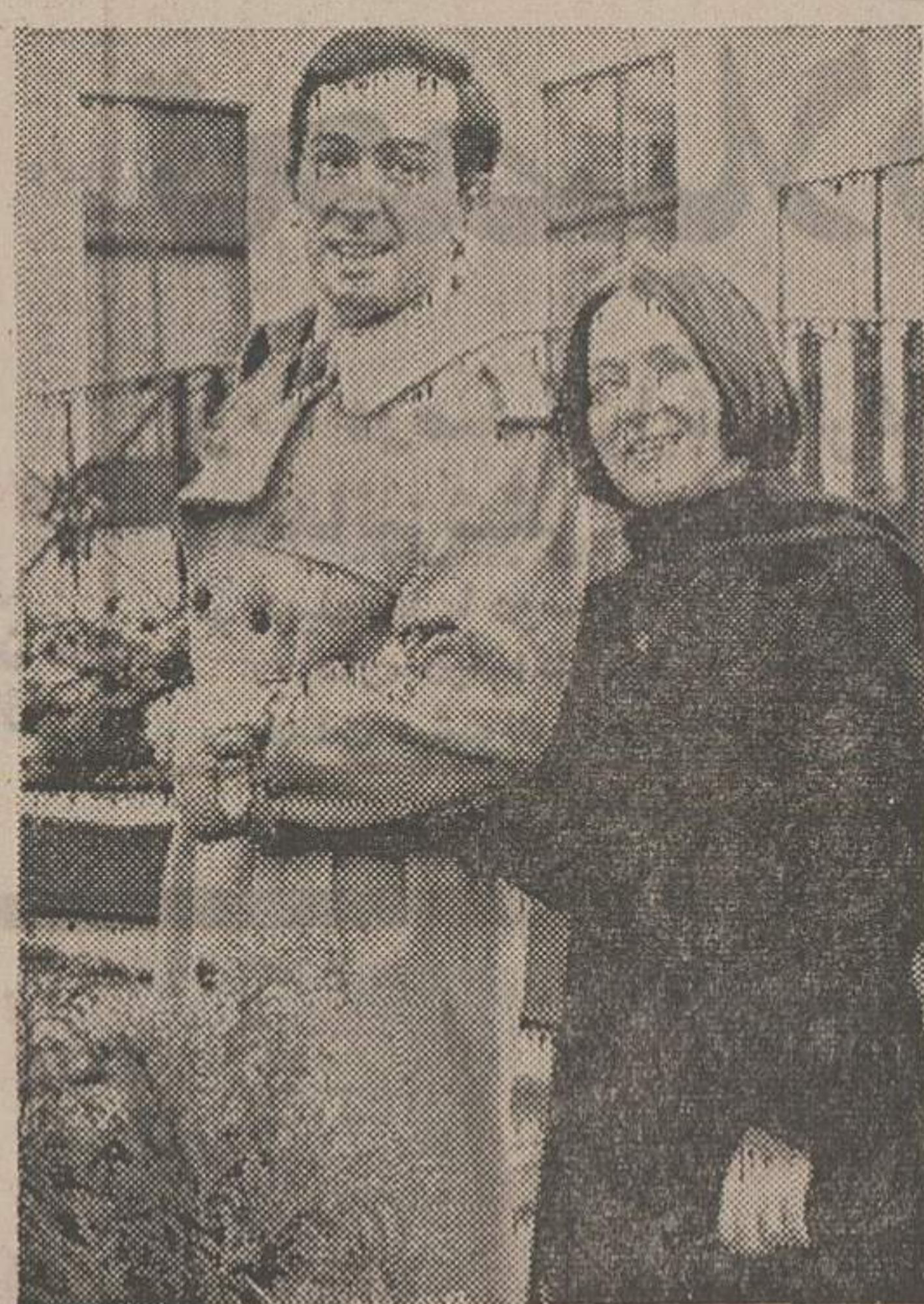
نخستین عکس از داماد کوبائی خانواده سلطنتی هلند با تاتاق پرنسس ماریاکریستینا . این عکس در کاخ سلطنتی هلند در آمستردام گرفته شده است .