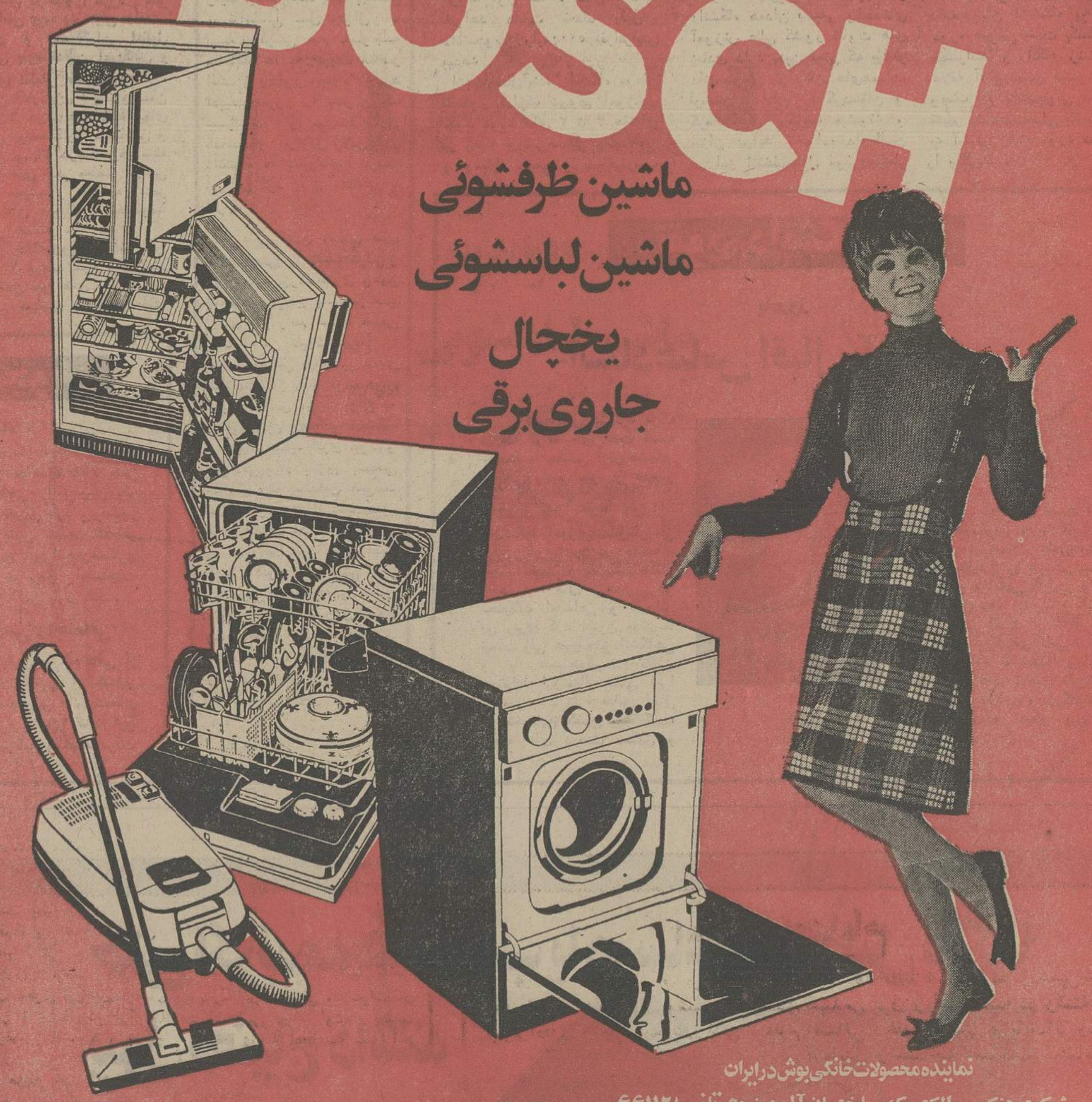
نماینده محصولات خانگی بوش در ایران شرکت هکتورد الکتریک ساختمان آلومینیوم تلفن ۶۶۱۱۲۸

ماشین ظرفشویی ماشین لباسشویی یخچال جاروی برقی