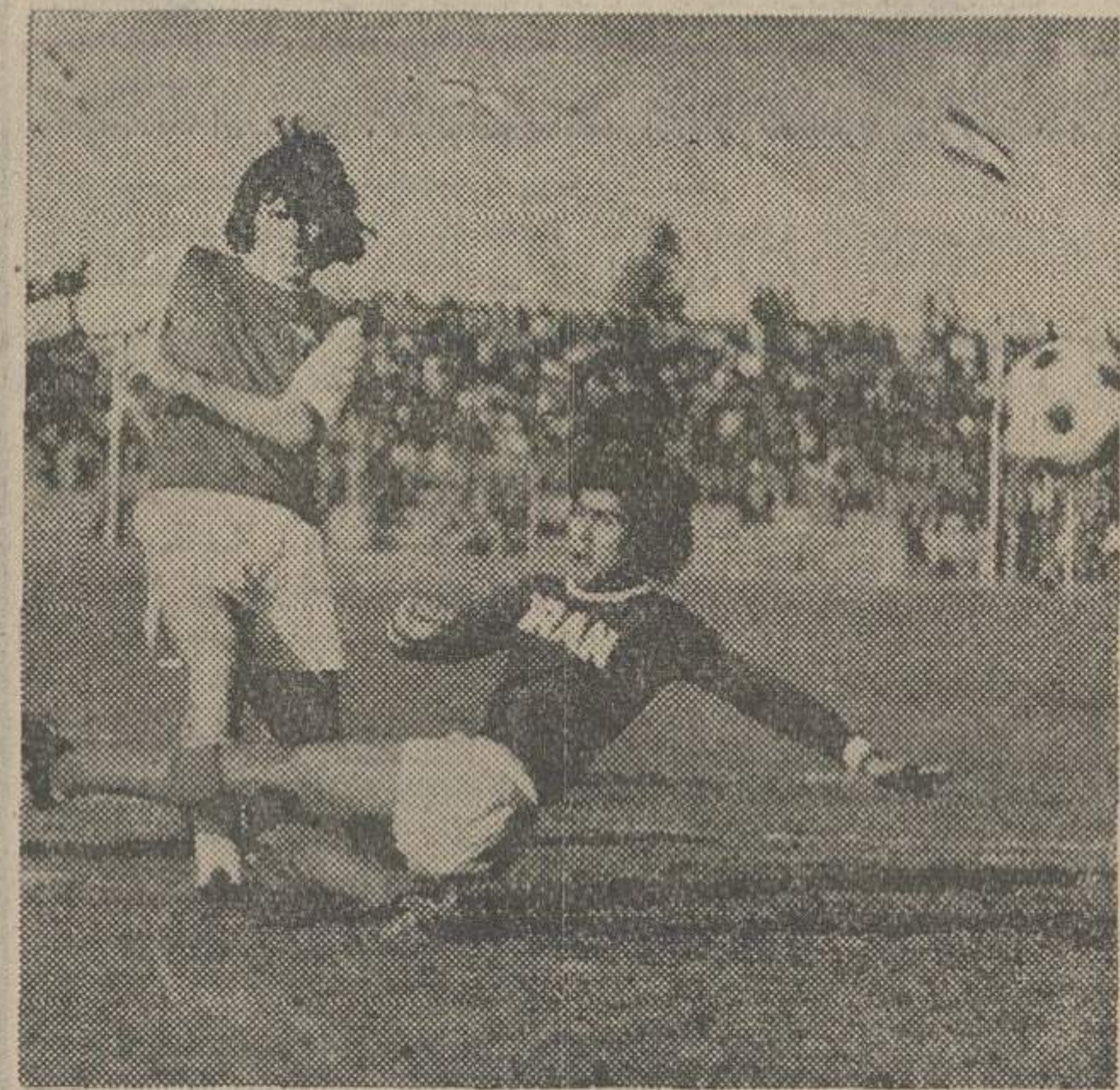
از بعد از ظهر دیروز دومین دوره مسابقات فوتبال جام بین المللی ولیمید با حضور ۱۰ تیم در دوشنبه اهواز و شیراز آغاز گردید.

در نخستین روز بازیها سه دیدار انجام شد به در جمع آنها حادثه بزرگ باشکست «ایران» صاحب عنوان قهرمانی بازیهای سال گذشته خلق شد که با نتیجه ۱-۰ مقابل تیم جوانان آرنستال انگلستان شکل گرفت و رویداد جالب دیگری روز اول پیروزی ۱-۰ «مجارستان» بر ایران پاکستان بود. مجارها که با نام تیم ملی جوانان در بازیها شرکت کرده اند، در برابر پاکستان فتوالی از «گل» برآمدند.