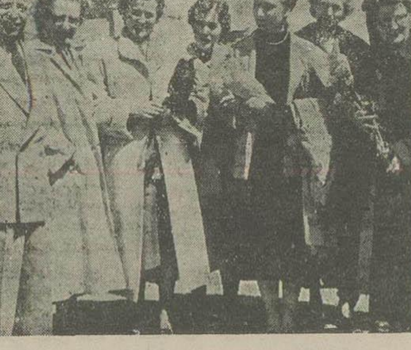
هیئت پرستاران و پزشکان آلمانی

بطوریکه دیروز اطلاع دادیم پیش نرف دو شیوه سرپرستار که از طرف بیمارستان بازرگانان از کشور آلمان استخدام شده است و سایرین نیز در قسمت های امرایش کلوی، رادیولوژی، آزمایشگاه، بیوشیمی تخصصی دارند.