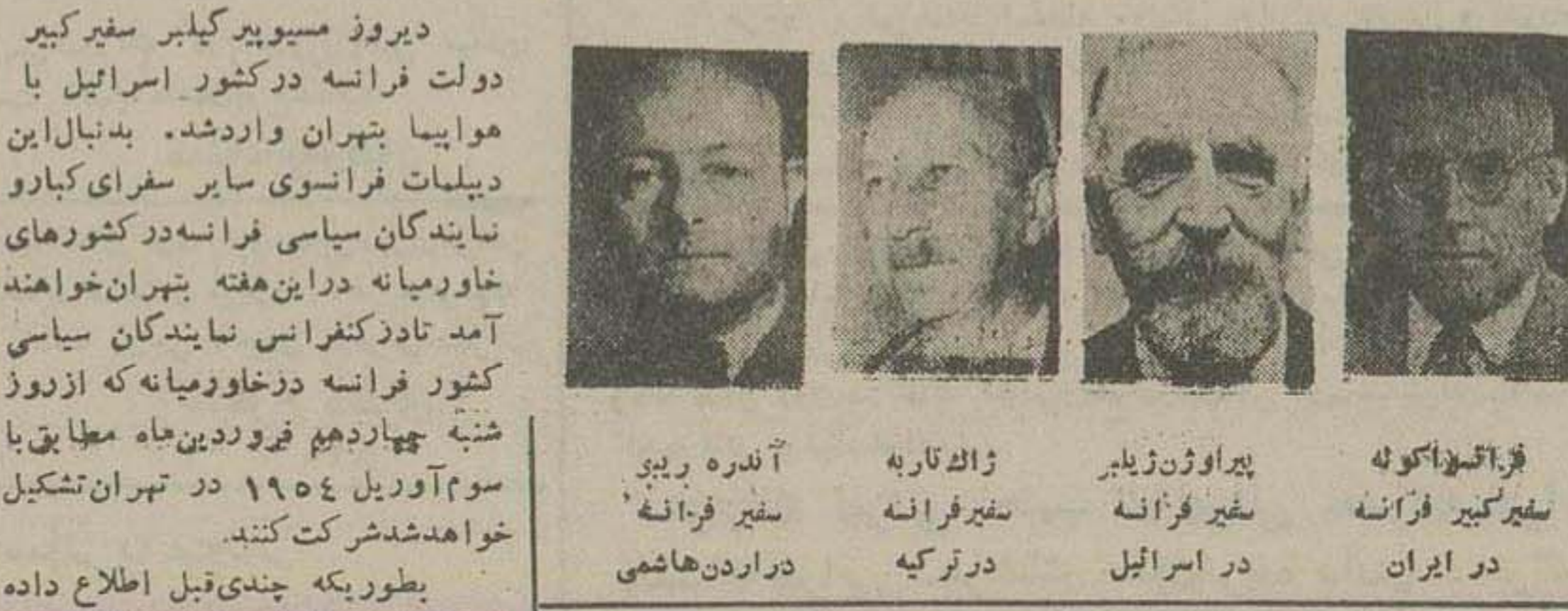
دو روز مسیو پیر کلبیر سفیر کبیر دولت فرانسه در کشور اسرائیل با هوایما به تهران وارد شد. بدینال این دیپلمات فرانسوی سایر سفیرای کبار و نمایندگان سیاسی فرانسه در کشورهای خاور میانه در این هفته به تهران خواهند آمد تا در کنفرانس نمایندگان سیاسی کشور فرانسه در خاور میانه که از روز شنبه چهاردهم فروردین ماه مطابق با سوم آوریل ۱۹۵۴ در تهران تشکیل خواهد شد شرکت کنند. بطوریکه چندی قبل اطلاع داده شد کنفرانس سایبا به سفیرای کبار فرانسه در خاور میانه در سال جاری در تهران تشکیل میشود و این کنفرانس می تواند یک هفته ادامه یابد و ضمن آن درباره سیاست خارجی کشور فرانسه در خاور میانه بحث گردد و برای هم آهنگی روش سیاسی نمایندگان کشورهای در خاور میانه تصمیماتی اتخاذ شود. نمایندگان سیاسی فرانسه در مدت اقامه کنفرانس میهمان سفارت فرانسه در تهران خواهند بود. بقیه در صفحه چهارم

روز شنبه کنفرانس دیپلماتهای فرانسه در تهران افتتاح میشود ریاست این کنفرانس را دکتر گل مصیبه وزارت امور خارجه فرانسه خواهد بود سفیر کبیر فرانسه در خاور میانه به حضور شاهنشاه شرفیاب خواهند شد و سایر سفیرای فرانسه در اسر ائیل دیر و زبته تهران وارد شد و سایر سفیرای فرانسه در این هفته وارد میشوند