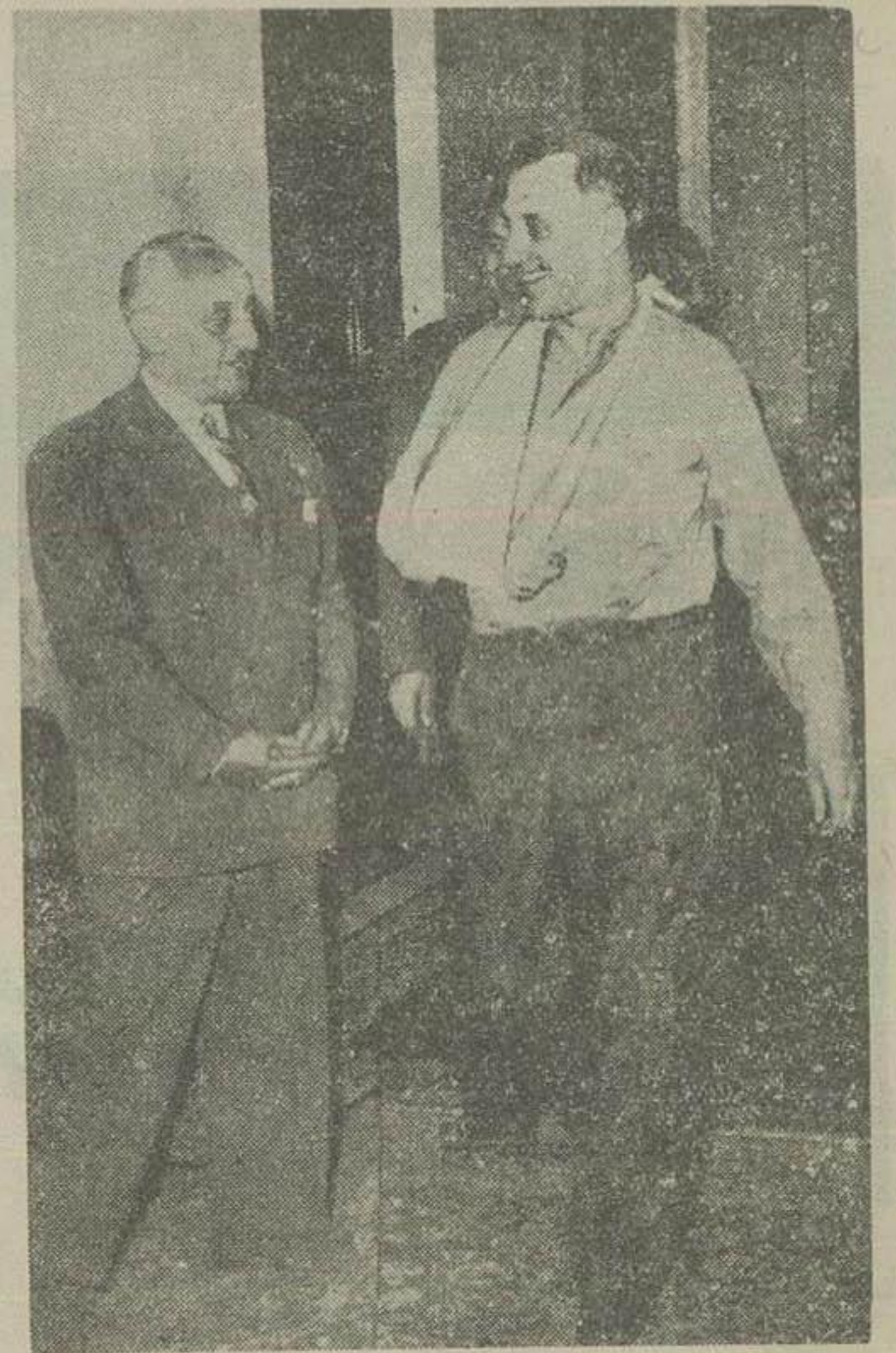
عکس بالا قبلاً از ظهر امروز هنگامی که آقای نخست وزیر برای ملاقات با مراجعین سالن باشگاه افسران میروند برداشته شده است آقای ایلخان ظفر بختیار وزیر مشاور نیز در عکس دیده میشود

آبادی است و من متأسف هستم چرا تاکنون با اهمیت فوق العاده این خاک زرخیز بی برده نشده و آفتوری که باید و شاید در باره اصلاحات این استان و اقدام بعمل نیورده اند.