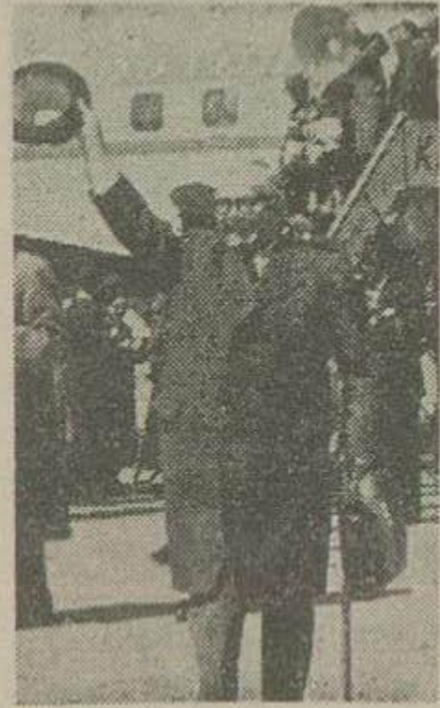
مدیر کل صنایع قند آلمان در فرودگاه مهرآباد

چندی قبل از طرف سازمان برنامه اقدام سفارش و خرید چهار کارخانه قند هفتصد تنی گردید که آگهی مناقصه آن نیز از طرف قسمت صنایع قند سازمان برنامه منتشر شد و پیشنهاداتی از