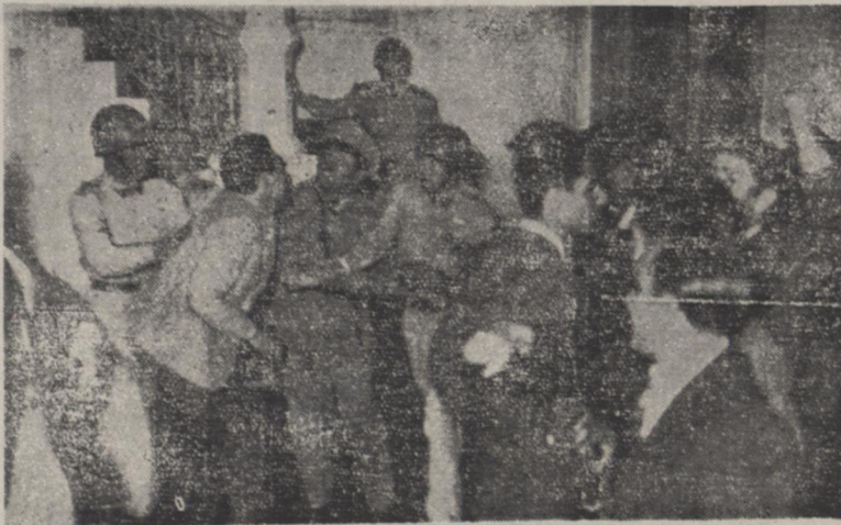
مده ای در لژ مخصوص تماشاچیان با تظاهراتی برداختند و مامورین انتظامی با خراج آنها از تالار جلسه اقدام نمودند