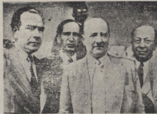
در جریان تشریفات تاجگذاری اعلیحضرت ملک فیصل پادشاه عراق آقای دکتر فاطمی وزیر خارجه فرصتی پیدا کرد، با آقای فواد کورپرو وزیر امور خارجه دولت ترکیه ملاقات و مذاکراتی بعمل آوردند دکتر فاطمی از وزیر خارجه ترکیه دعوت بعمل آورده است که مسافرتی به ایران کند در عکس بالا آقایان دکتر فاطمی و کورپرو و یکی از اعضای هیئت دولت ترکیه در بغداد دیده میشوند.

نمایندگان که میخواستند برای ایراد نطق قبل از دستور ثبت نام نمایند دیشب را در مجلس گذرانیدند بامداد امروز میان نمایندگان اقلیت و اکثریت بر سر ثبت نام در جلوی تالوی مخصوص کشمکش در گرفت قبل از جلسه علنی، جلسه خصوصی تشکیل شد