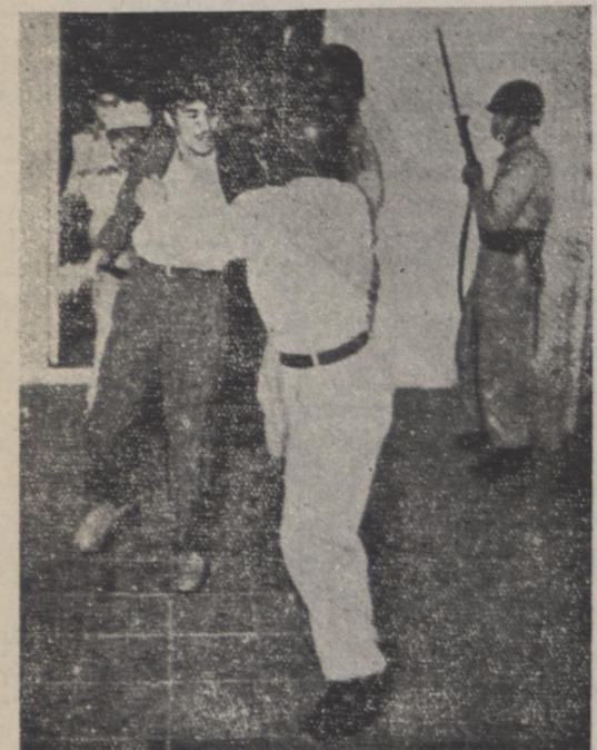
یکی از سرمازان در حال کشمکش با یکی از تظاهر کنندگان