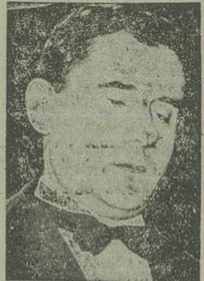
آندره گرومیکو معاون وزارت خارجه شوروی

اکنون رئیس جمهور فرانسه میسواوربول باردیگر از میسوا (رنه پلون) که متناوب بجزب رادیکال است و سابقا عهده دار وزارت دفاع بوده تقاضا نموده است که برای تشکیل کابینه تلاش کند.