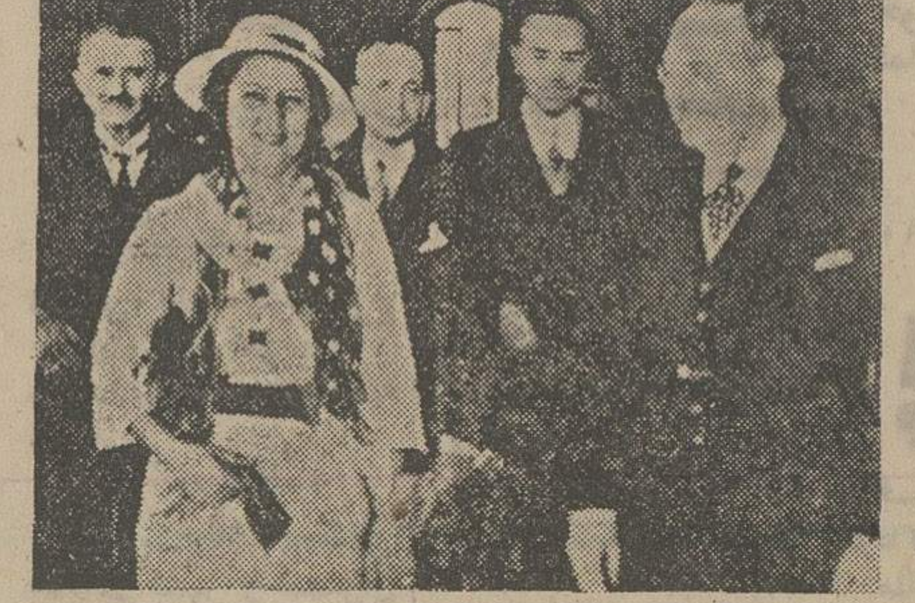
آقای کاظمی وزیر امور خارجه با اتفاق خان نوری سعید پاشا از محل پذیرائی قرونه گاه قلمبرخی خارج میشوند. آقایان وزیر مختار عراق، دولتها حکمران طهران و ممتاز عضو تشریفات نیز در عکس دیده میشوند.

بعد از ظهر امروز هیئت نمایندگی دولت پادشاهی عراق مرکب از آقایان نوری سعید پاشا وزیر خارجه و محمد زکی بیک وزیر عدلیه دولت و سایر همراهان به طهران ورود نمودند. پس از آنکه طیاره عراقی در فرودگاه قلمه مرغی فرود آمد آقای کاظمی وزیر امور خارجه، رئیس کل هواپیمائی، حاکم طهران، کتبل نظیبه، کتبل بلدیه، روسای ادارات اول و چهارم سیاسی و کتبل تشریفات وزارت امور خارجه با لباس ژاکت و کلاه بلند در فرودگاه از مهمانان استقبال کردند و بعد از معرفی مسئولین قصبه که قریب یکسال است بطول و مختصر تفریحی عازم قصر صاحبقرانیه شدند - عصر امروز وزرای خارجه و عدلیه عراق از آقای رئیس الوزرا و در عمارت نایبالتی هیئت وزراء، و آقای رئیس مجلس در عمارت مجلس شورای ملی و آقای وزیر امور خارجه در عمارت ییلاقی ندین بینامید و برای سایر وزراء و روسای دربار شاهنشاهی و معاون وزارت خارجه و سایر مسئولین کارت می گذارند. ساعت هشت و نیم بعد از ظهر از طرف آقای وزیر امور خارجه مهمانی شامی در قصر صاحبقرانیه برپا میشود.