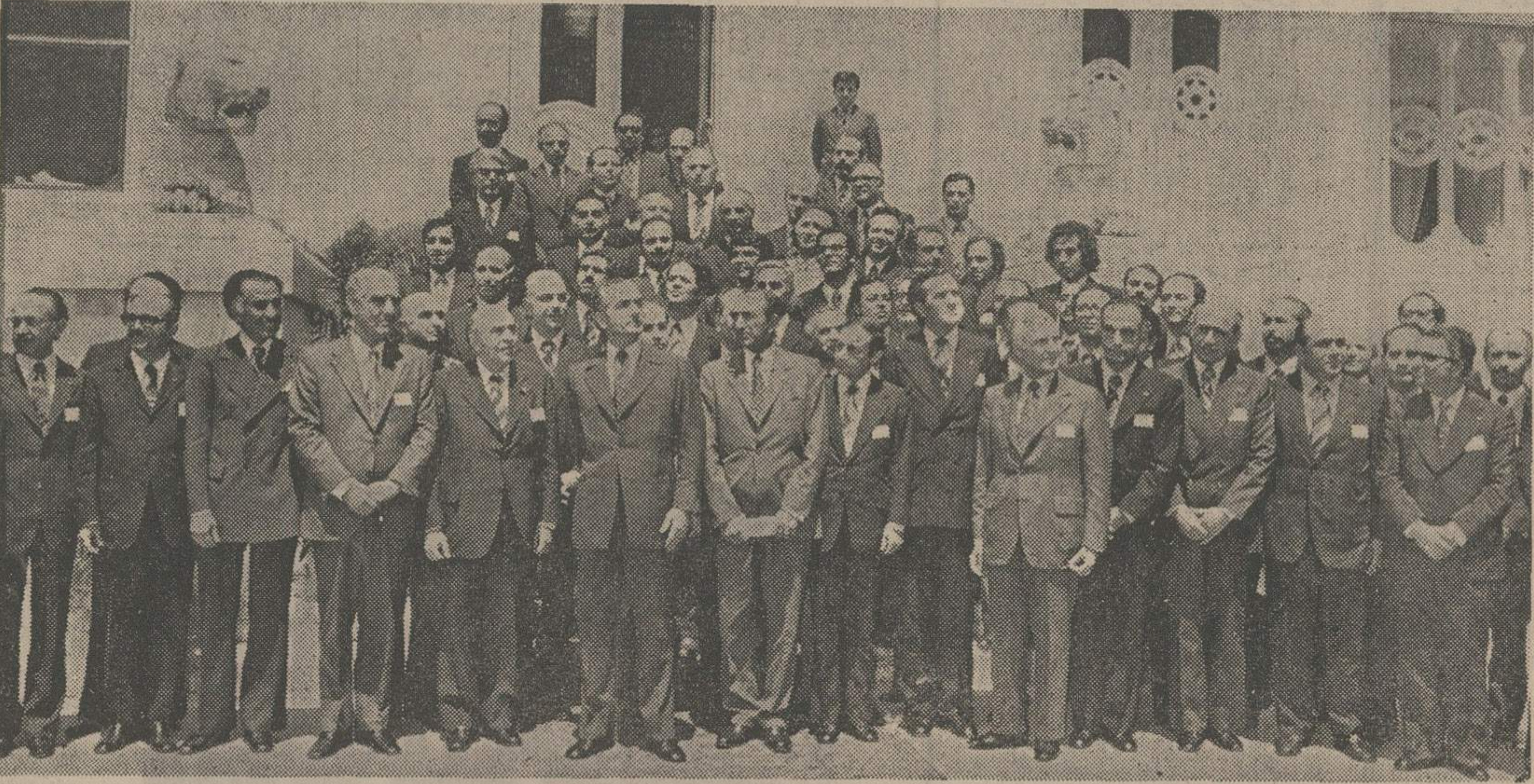
شاهنشاه آریامهر، در پایان جلسات کنفرانس رامسر، این افتخار را به شرکت کنندگان کنفرانس دادند که عکس در پیشگاه معظله به یادگار گرفته شود. نخست‌وزیر، وزیر دربار، رئیس شرکت ملی نفت، اعضای دولت و کارشناسان برنامه ریزی حضور دارند.

باید مراقب باشیم که پیشرفت‌های تکنولوژیک، فساد و تباهی را به جامعه ما تحمیل نکند زنان سهم بیشتری در بر نامه جدید مملکت خواهند داشت در صفحه ۵