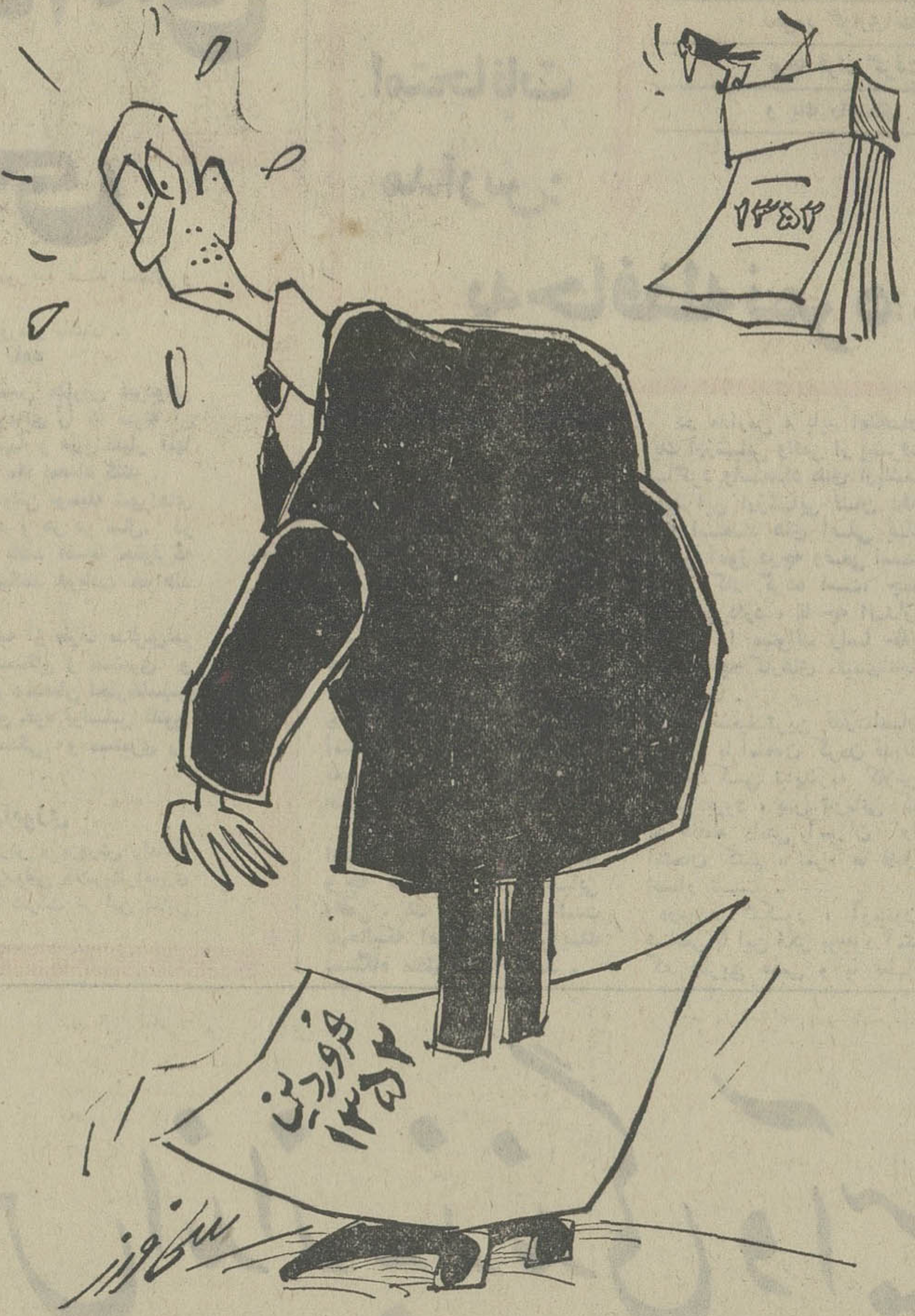
برمی از تقویم سال نو ! ...

مخارج پیش بینی نشده فروردین ماه اکثر کارمندان دولت را با کمبود مالی روبرو کرده است