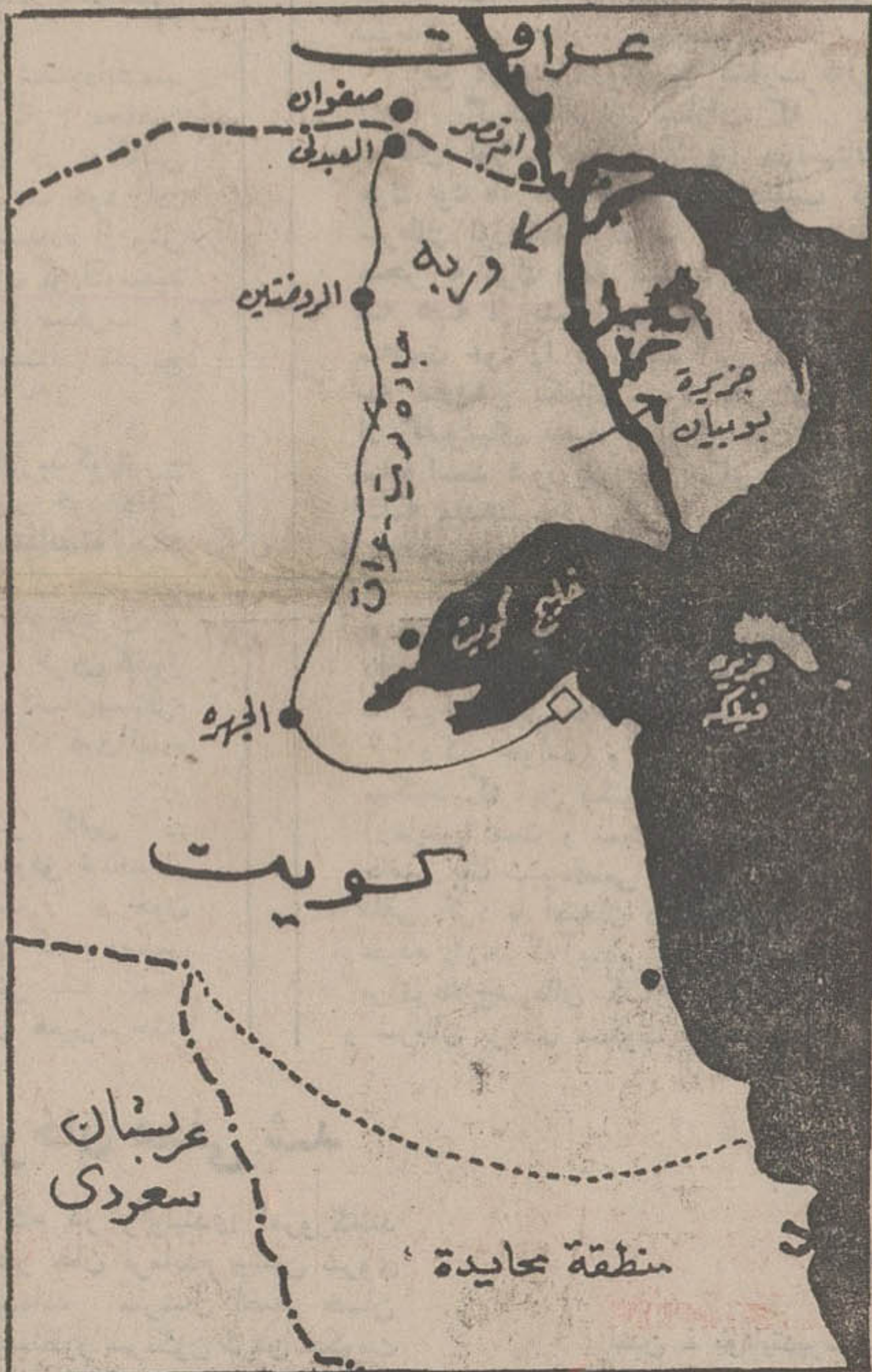
در نقشه بالا موقعیت دو جزیره «بویان» و «وربه» که عراق خواستار آنهاست مشخص شده است