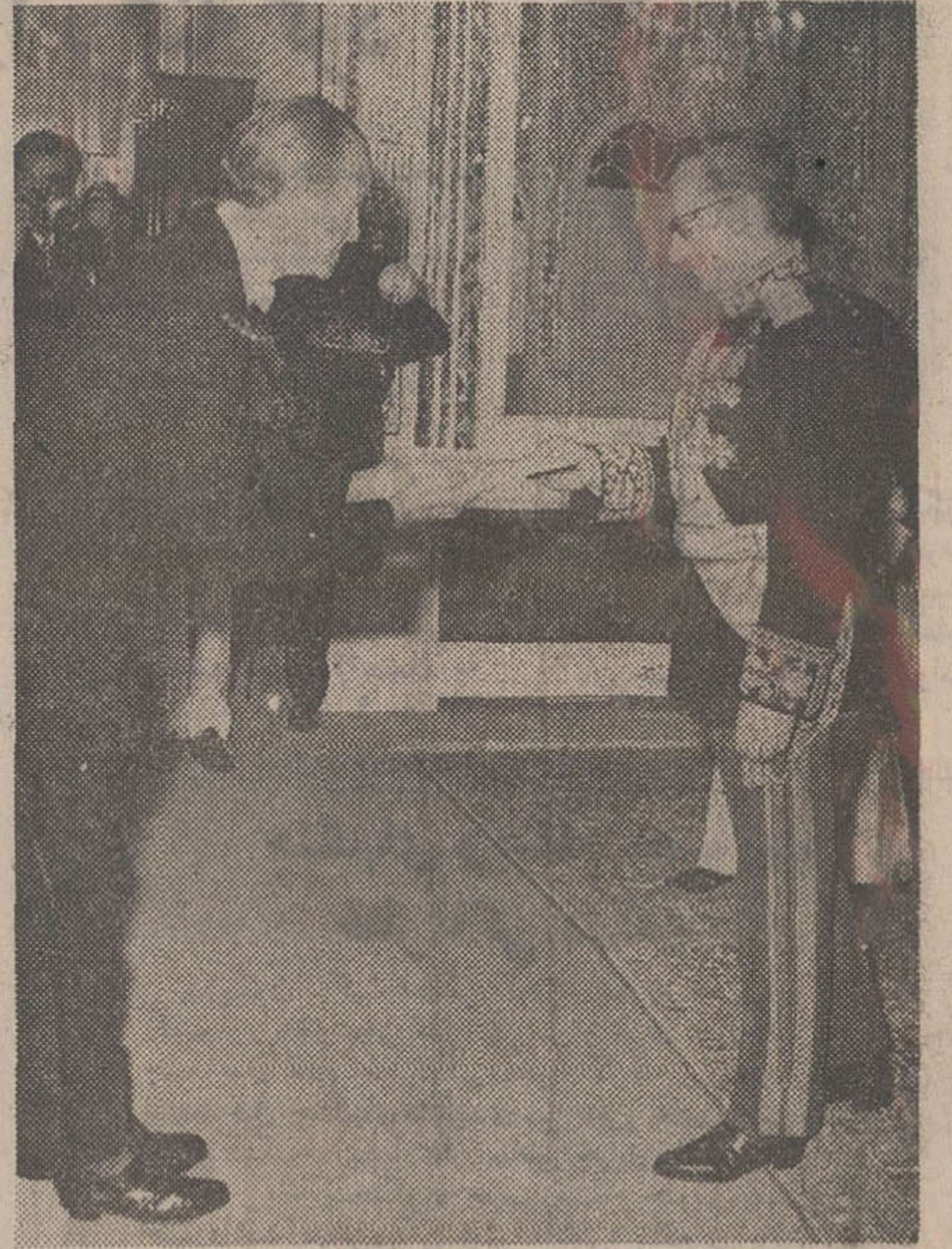
شاهنشاه آریامهر ساعت ده باعداد امروز آقای ریچارد هلمز سفیر امریکا در دربار شاهنشاهی را در کاخ نیاوران بحضور پذیرفتند در این شرفیابی سفیر امریکا استوارنامه خود را به پیشگاه معظله تقدیم داشت.

مخالف سیاسی انگلیس اعلام کردند سفر نخست وزیر به لندن به گسترش روابط دو کشور کمک می کند در صفحه آخر