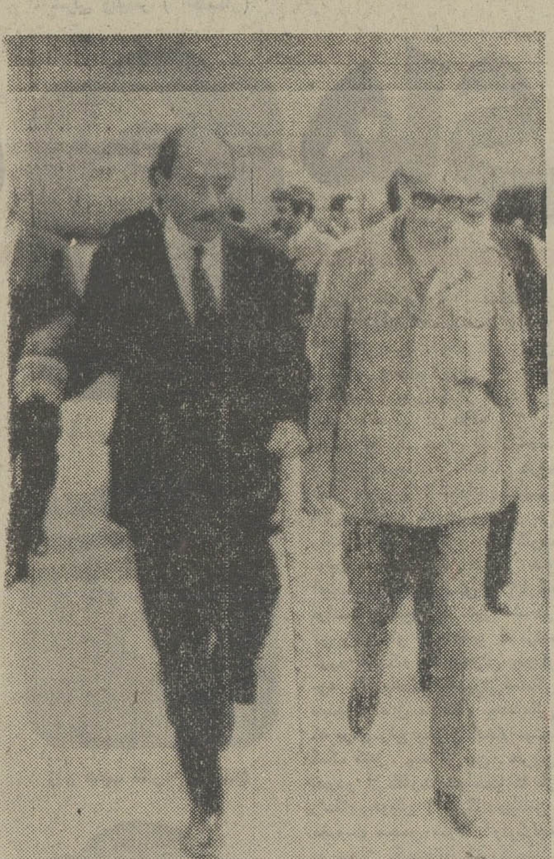
مذاکره درباره بحران خاورمیانه سادات پس از مذاکرات فصل با سرهنگ قذافی در باره تحولات منطقه عربی خاورمیانه و راه‌های تحت فشار قراردادن اسرائیل از تریپولی در لیبی به بارقه بازگشت. عکس از سادات و سرهنگ قذافی را در مقاله‌های تریپولی نشان میدهد.

سخنانی که انورالسادات رئیس جمهور مصر در مصاحبه اخیر خود با خبرنگار نوین مجله نیویورک ابراز داشت حاکی است که او