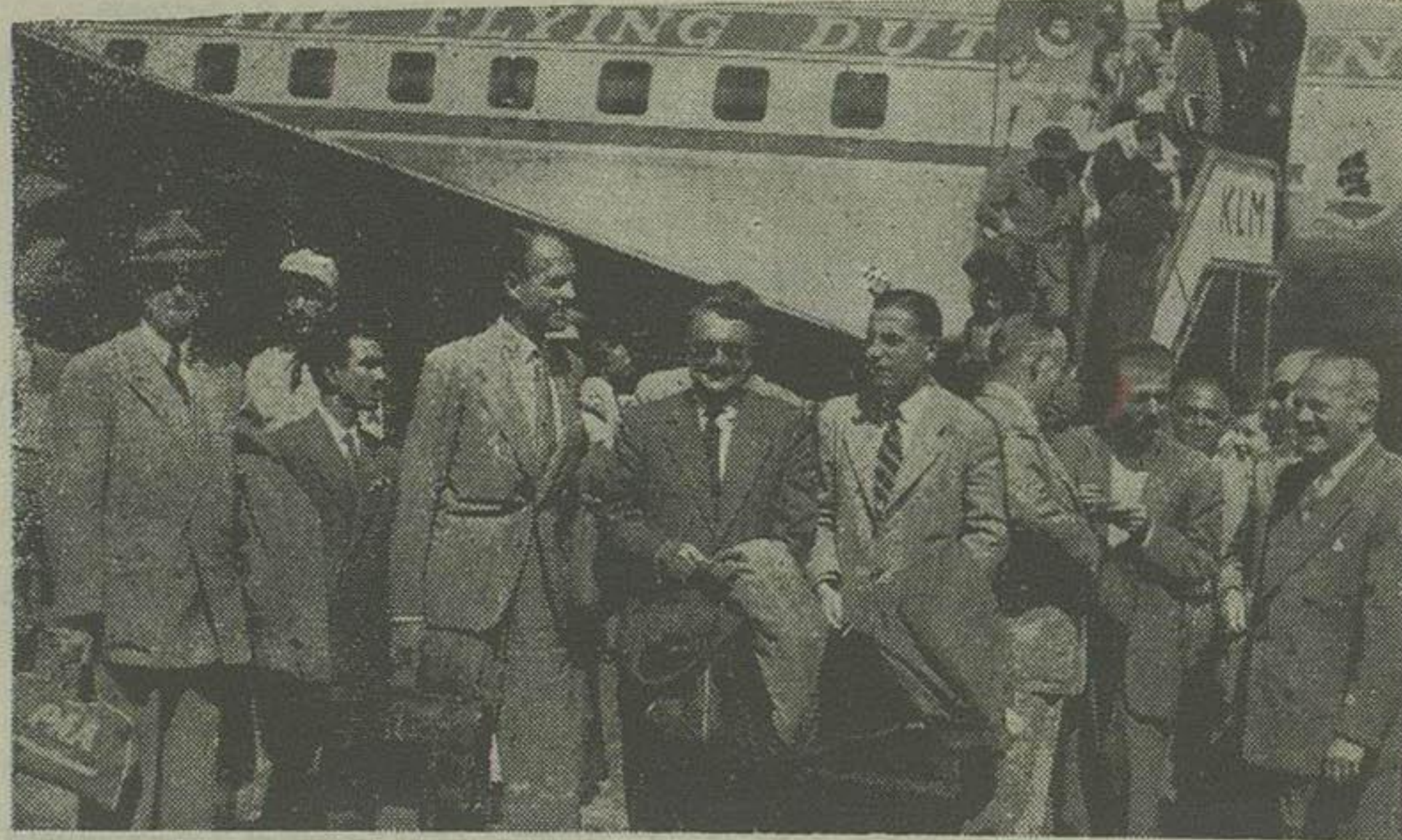
در عکس بالا اولین دسته هیئت کارشناسان بین المللی نفت در فرودگاه مهر آباد دیده میشوند

ساعت دو و با تازده دقیقه صبح امروز اولین هیئت کارشناسان کنسرسیوم مامور رسیدگی بوضع پالایشگاه آبادان و برآورد اعتبار تعمیرات پالایشگاه با هواپیمای تهران وارد شدند.