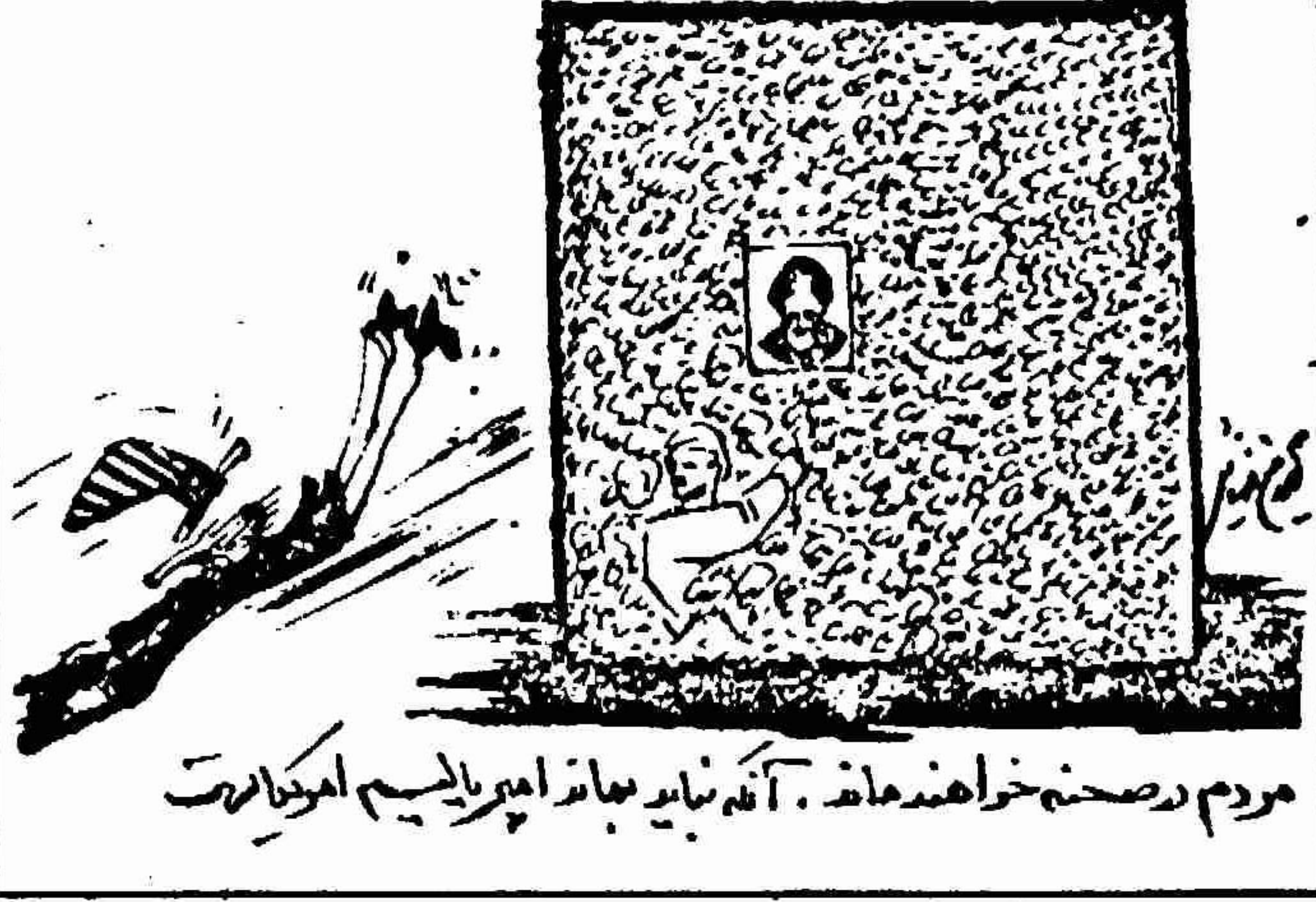
مردم روضه خواهند ماند، آنگاه باید بهانه‌ها را هم با سیم امرواریت

در پایان اوت (۹ شهریور) اسال، شماره بیکاران برلین غربی متجاوز از دهمصد بیشتر از بیکره همانه در سال گذشته بود. بدین ترتیب، ماه ۲۱۲۱ بیکار رسمی، شمار بیکاران نسبت به ماه پیشین تغییر محسوسی نکرد. در پایان ژوئیه (۹ مرداد) در برلین غربی ۲۱۵۹۲ بیکار بودند. بدین سان، بیکاری در این شهر به پدیده‌ای دائمی تبدیل شده است، که بوجی ادماهای "سوسیالیستی" برلین غربی را در باره گرایش‌های مثبتی در این زمینه اثبات می‌کند. در پایان اوت ۱۹۸۰ (۹ شهریور ۱۳۵۹) شماره بیکاران برلین غربی ۲۰۷۲۴ تن بیشتر از پایان اوت ۱۹۷۹ (۹ شهریور ۱۳۵۸) بود. همین دیگر، نرخ بیکاری در برلین غربی، در یکسال گذشته ۳/۵٪ به ۲/۹ درصد افزایش یافت.