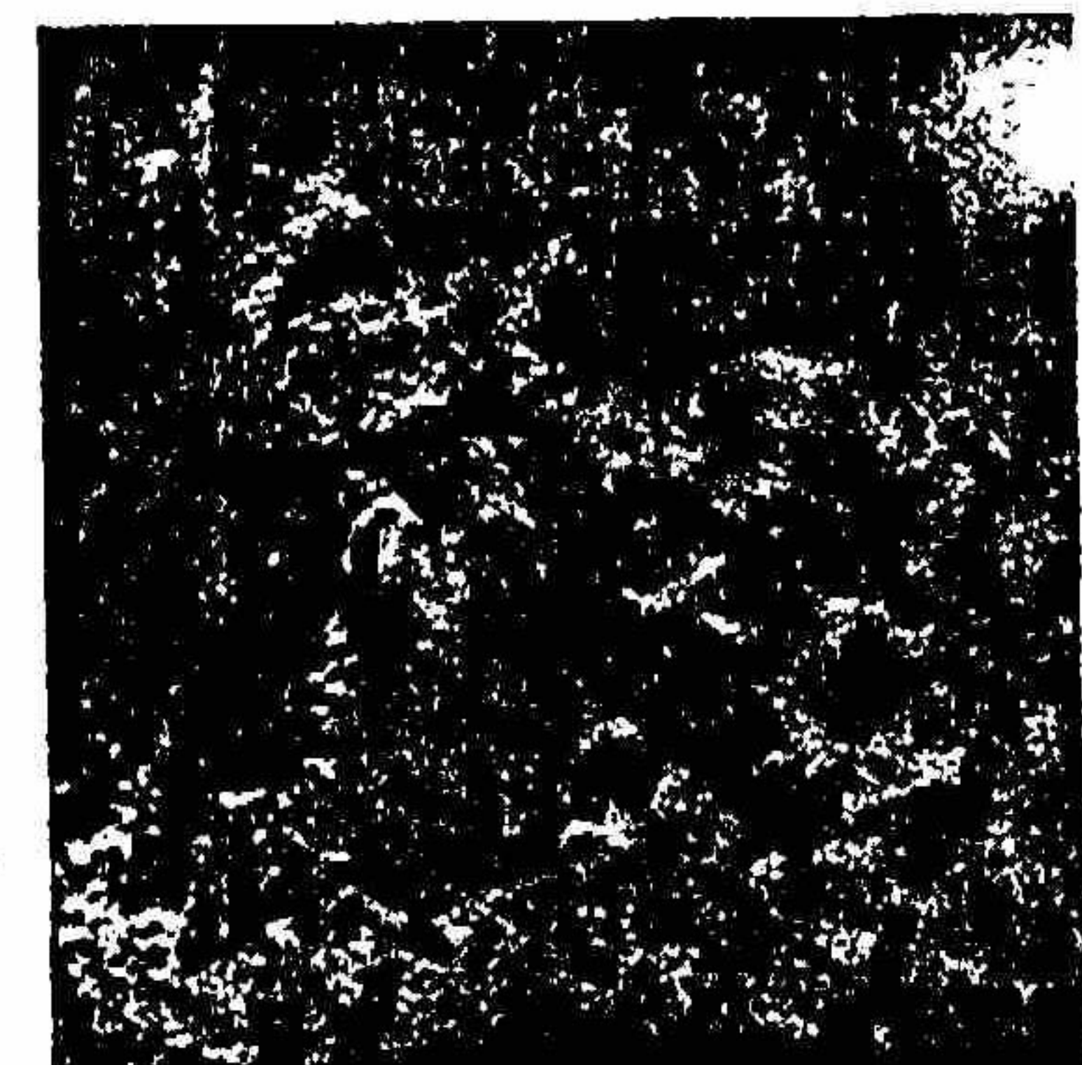
پارک آزادی شیراز - سه باغبان پیر مشغول غویی گلها

کار نگهبانی پارک آزادی به عهده چهار نفر از کارگران قرار دارد که در دو نوبت: از هفت صبح تا هفت بعد از ظهر و بالعکس کار می‌کنند. این عهده علاوه بر نگهبانی و حفاظت گل‌ها، مسئول نظافت پارک نیز هستند. یکی از کارگران سالدوخته نگهبان می‌گوید: