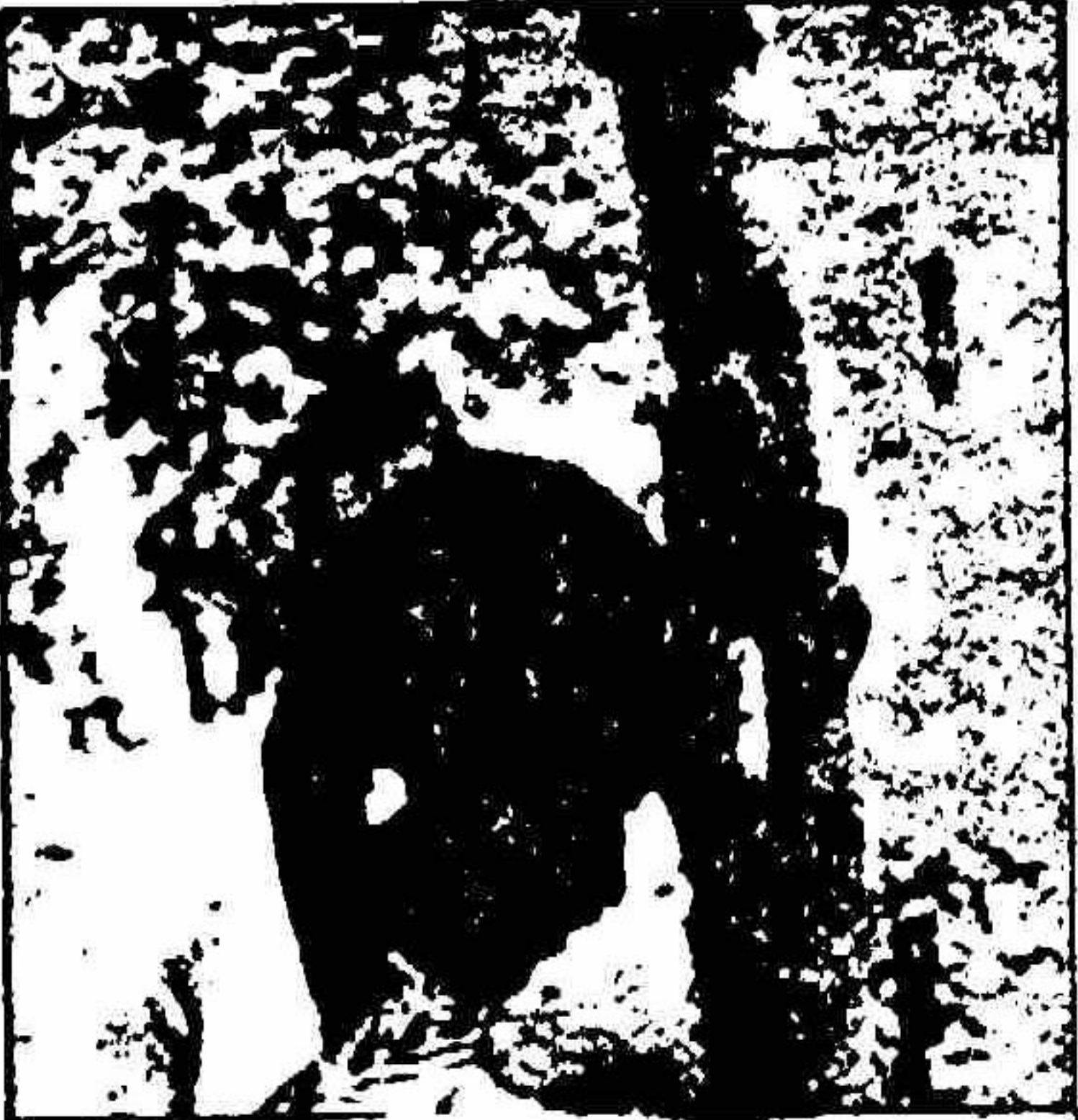
پارک آزادی شیراز - کارگر جوانی که از فرط خستگی به سایه درخت پناه برده است، از گوشه چرم می‌آید، ولی مجبور است کار کند.

در پارک آزادی حدود چهار نفر به شغل باغبانی اشتغال دارند، که بیشتر آنها از زمان افتتاح پارک در این جا کار می‌کنند. در میان آنها کارگرانی یافت می‌شوند که بیست و نوزده سال سن دارند. این کارگران باید تا آخر عمر کار کنند، زیرا حقوق ناچیز بازنشستگی به هیچ وجه کفاف زندگی آنها را نمی‌دهد. یکی از کارگران باغبان، در حالی که از گوشه‌ای چرم می‌آمد و به علت ضعف روی خاک و گل ولای زیر درختی دراز کشیده بود، گفت: