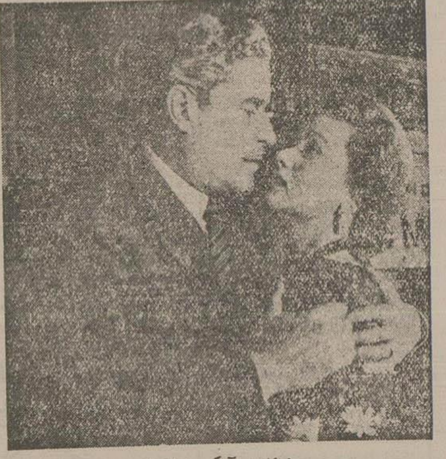
(کانون آکبلی شاعر)

۱۹۰۰ ریال فروشگاه های جنرال المد خیابان سعدی بالاتر از شرکت بیمه کلفن - ۳۳۹۹۳ لاله زار کوچه برلن تلفن ۴۴۷۲۳ ۲۰۷۶۸-۲ «از شرقی»