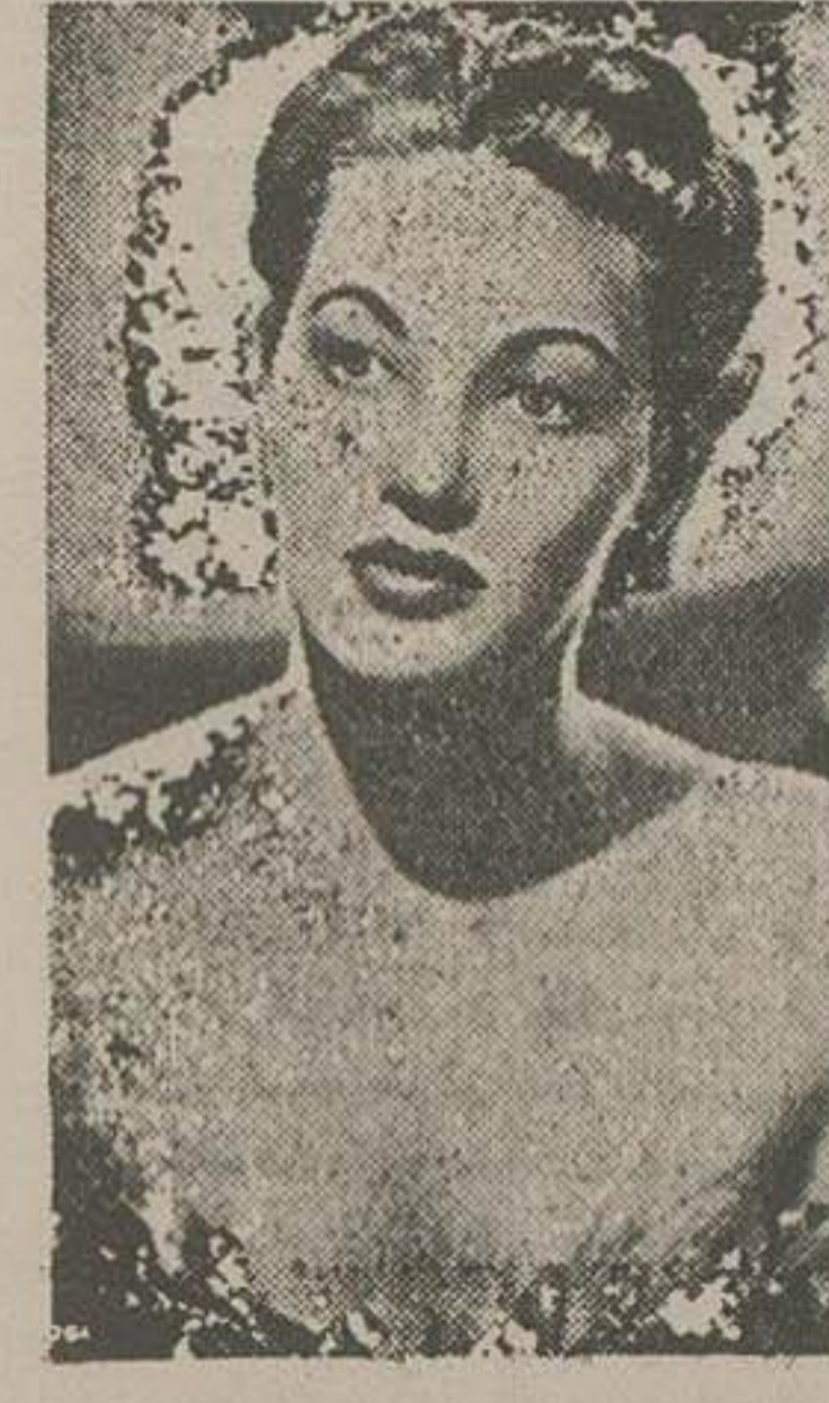
ایوان دو کارلو بالاخره ازدواج کرده