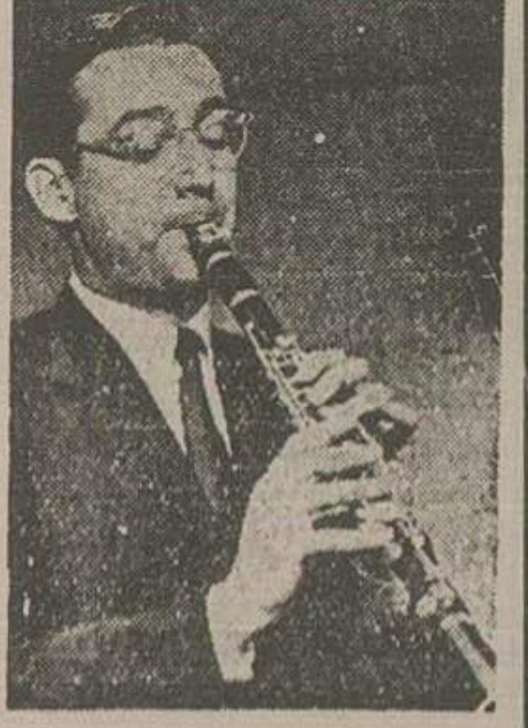
ایستوآلی هنریشه معروف تلویزیون قش (بنی گودمن) بازی خواهد کرد