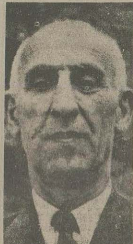
تصمیم گیری کمیسیون مختص شورای ملی

گزارش کمیسیون استغاده - چگونه استغاده دولت - مصاحبه سقیر کبیر انگلیس - جریان جلسه خصوصی مجلس شورای ملی - رأی تمایل مجلس - طرح و وضع نقش در مجلس - جلسه خصوصی سنا - نطق های نمایندگان از مطالب مهم روز است که بطریق که وقوع یافته از عصر پنجشنبه تا عصر ام روز اثر تک تاریخ و سوابق وقوع بشهر هم این حوادث را باطلاع خوانندگان گرامی میرسانیم