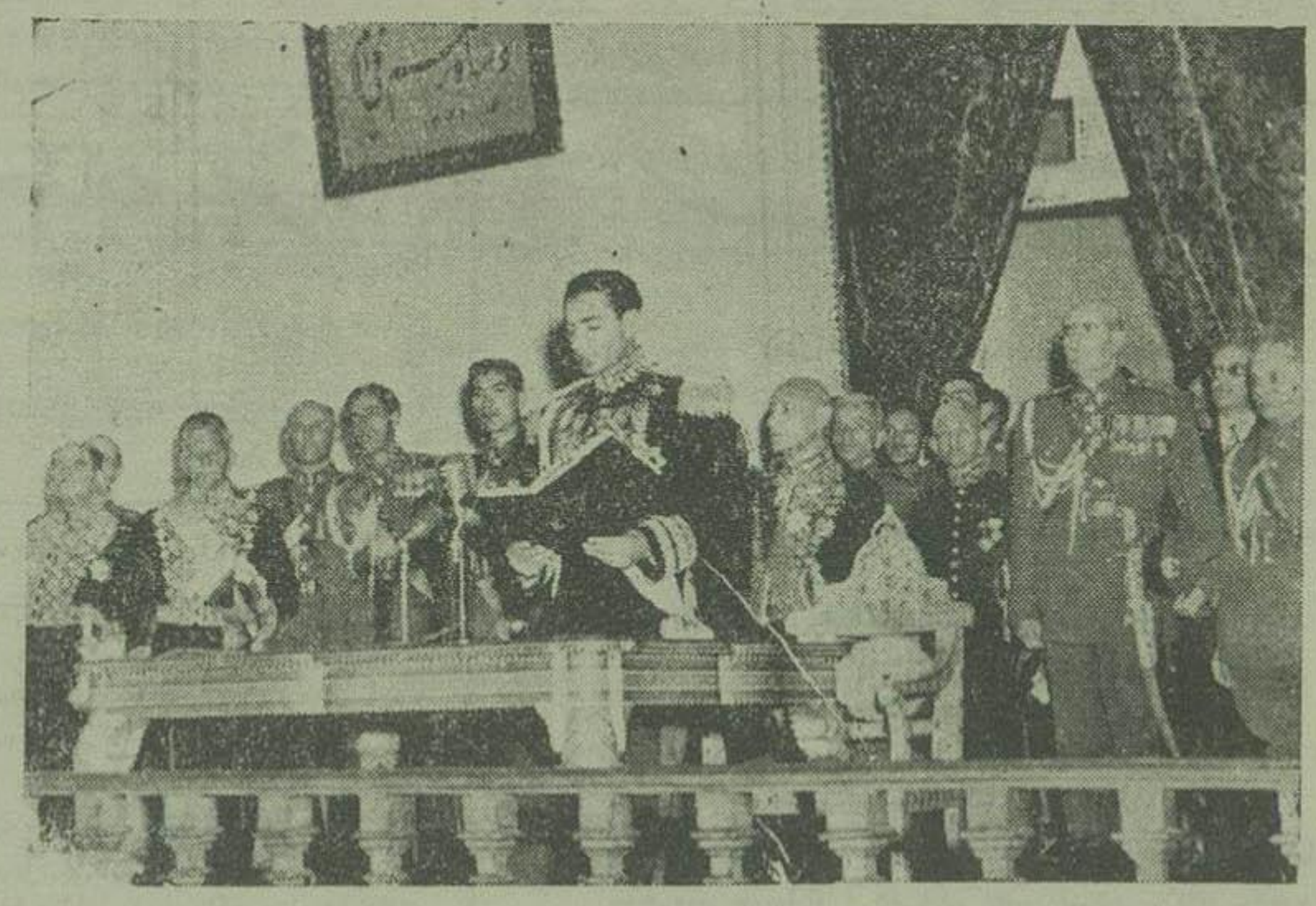
اعلیحضرت همایونی، در برابر نمایندگان سنا، سخن افتتاحیه را ایراد فرمودند

توزیر قریب ۱۵ دقیقه بهامت ۱۰ پادشاه باقی بود که اوتومیل حامل اعلیحضرت همایونی، از چهارراه مخصوص سردرستی، بست بهارستان پس در آمد اهالی تهران، کسانی که از مراسم افتتاح مجلس سنا و تشریف فرمایی اعلیحضرت پادشاه اطلاع داشته، از مدتی قبل، در انتظار دیدار شاهنشاه، در دو طرف مسیر صف کشیده بودند. هنگامی که اولین دسته نیزه دار پیدار میشد، مردم برای شاهنشاه کف میزدند و موقتی این ابراز احساسات پستپی درجه میرسد که اعلیحضرت همایونی، بهقابل مردم میرسد.