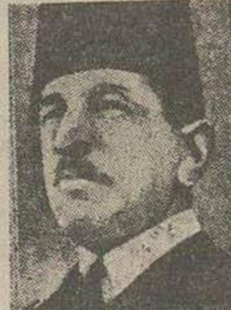
علی ماهر پاشا