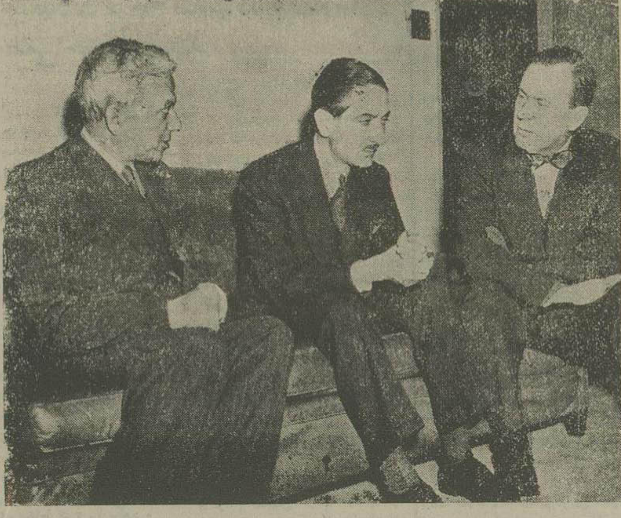
چین سه مرد از راست بچپ مستر بیرسون وزیر خارجه کانادا، آقای انتظام رئیس مجمع سازمان ملل متحد و سربنگال راتز نماینده دولت هندوستان که جمعا کمیسیون سه نفری مامور اعلام متار که جنگ در کره را تشکیل میدهند در لحظه در انتظار پاسخ چین کمونیست هستند.

های مشترک المنافع پای خود را از هر گونه قیل و قال سیاسی و خونی بازی کنار خواهند کشید و چنانچه کار بجای آید یک یک بکشند تنها کوشش آنها را بر عهده خواهند داشت که بوسیله اعلا نه ترموجبات رضایت رهبران کمونیست چین فراهم سازند.